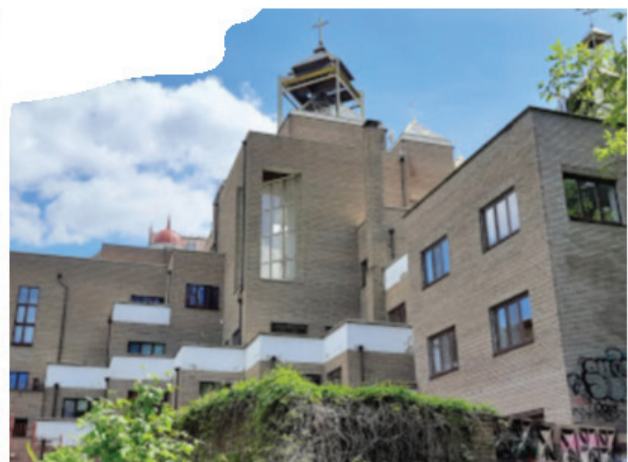
Рис. 4. Церква Василя Великого на Вознесенському узвозі в Києві. Архітектор і творець всієї ідеї Лариса Скорик. Освячена 2001 р. Екстер'єр зі входу та з двору (з боку яру)