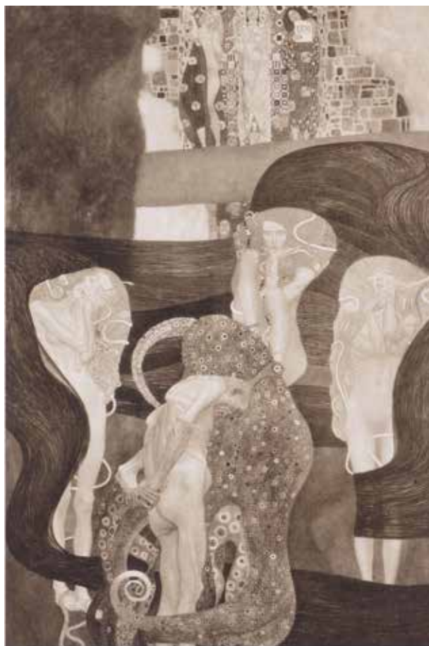
Іл. 11. Густав Клімт. «Юриспруденція», 1903, не збереглася

Наступним кроком Клімт із колегами візьметься за розпис Художньо-історичного