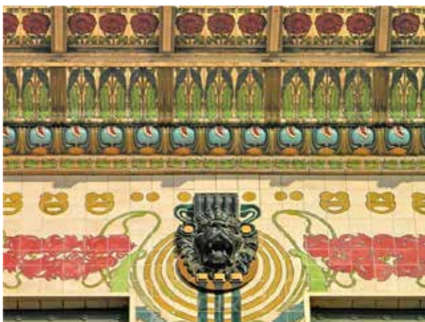
Іл. 15. О. Вагнер. Майоліковий дім, фрагмент декору, Відень, 1898

принципів та прийомів, які знайшли своє продовження у творчості Федора Кричевського. Дані принципи і прийоми, характерні для монументально-декоративного мистецтва модерну Віденської школи, найбільш характерно проявилися під час створення триптиху «Життя» – одного з найвідоміших творів Ф. Кричевського. У цій роботі прямо прочитується віяння модного у ті часи сецесійного мислення. Одним із найхарактерніших прийомів, використаних Ф. Кричевським, є декоративно-площинне вирішення силуетів фігур, притаманне стилістиці Віденської школи. Найбільш «віденською» є частина триптиху – «Кохання» у якій із першого погляду прочитується вплив твору «Поцілунок» Гюстава Клімта. Тож використання принципів та прийомів, характерних для епохи модерну, значно збагатило творчі пошуки Федора Кричевського, відзначається характерний вплив форм, засобів та стилістики віденських майстрів початку ХХ ст.