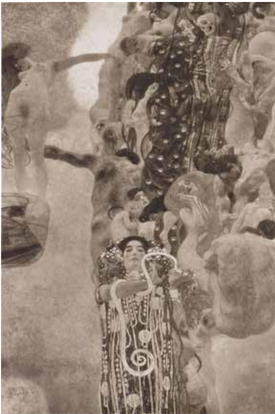
Іл. 9. Густав Клімт. «Філософія» (1898–1900), не збереглася