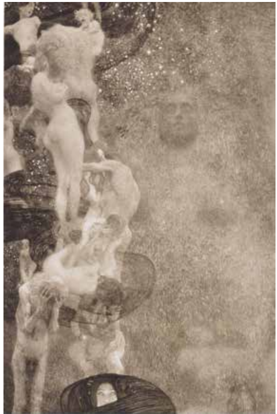
Іл. 10. Густав Клімт. «Медицина», 1900, не збереглася