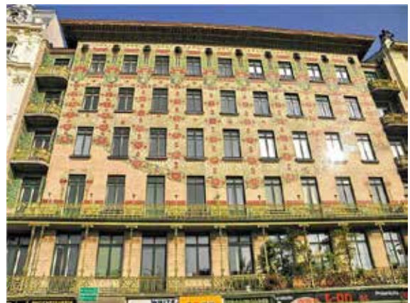
Іл. 14. О. Вагнер. Майоліковий дім, фрагмент декору, Відень, 1898