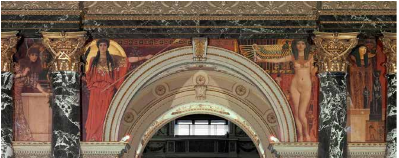
Іл. 12. Густав Клімт. Інтер'єр Kunsthistorisches Museum, Відень, 1890–1891 (фреска)

вулиці Лінке-Вінцайле, 40, «Майоліковий дім» і будинок по вулиці Кестлергассе (іл. 13–15). Вони належать до найвиразніших пам'яток Відня, виконаних у стилі артнуво [10, р. 68]. Цей проєкт житлового комплексу у доробку архітектора був наймасштабнішим на момент будівництва (складався з 50 квартир).