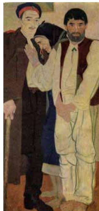
Іл. 1. Ф. Кричевський. Триптих «Земля», ліва частина «Любов», 1925, НХМУ