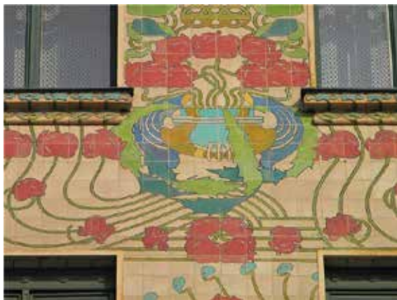
Іл. 13. О. Вагнер. Майоліковий дім, фасад, Відень, 1898

Розглянувши прийоми, використані у монументальних роботах Густава Клімта та майоліковий декор у архітектурі Отто Вагнера, ми можемо виявити стилістичне наслідування