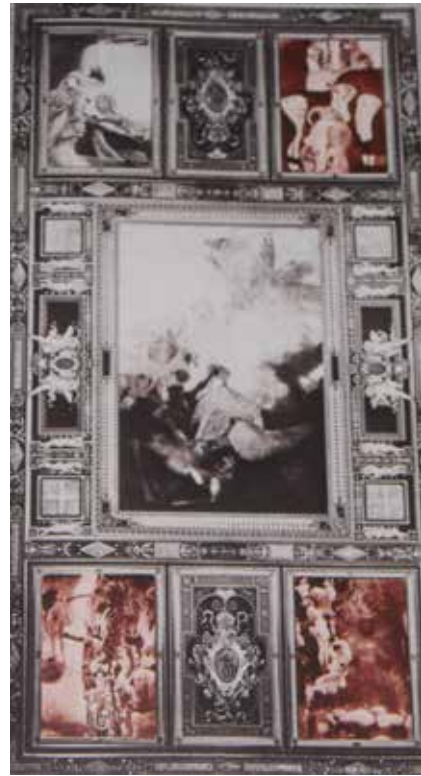
Іл. 8. Густав Клімт. Панно аудиторії Віденського університету. Реконструкція проєкту розміщення трьох панно Клімта (виділено червоним), реконструкція Маттео Чіні

у березні 1901 р. презентував друге панно – «Медицина». На ньому людство, оголені фігури молодих і старих, перебуває у невизначеному просторі, а смерть огортає їх чорним покривалом. На першому плані стоїть верховна жриця (збереглися кольорові ескізи цієї роботи, на яких жриця вдягнена в червону сукню із золотом). Вона тримає на руках змію. Замість возвеличення науки художник представив безглуздий перехід від життя до смерті (іл. 10).