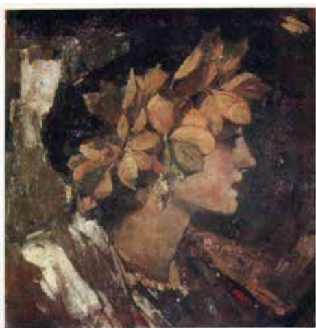
Іл. 3. Ф. Кричевський. Триптих «Земля», права частина, 1925, НХМУ