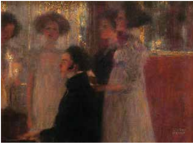
Іл. 7. Густав Клімт. «Шуберт за піаніно», 1899, Приватна колекція

у березні 1901 р. презентував друге панно – «Медицина». На ньому людство, оголені фігури молодих і старих, перебуває у невизначеному просторі, а смерть огортає їх чорним покривалом. На першому плані стоїть верховна жриця (збереглися кольорові ескізи цієї роботи, на яких жриця вдягнена в червону сукню із золотом). Вона тримає на руках змію. Замість возвеличення науки художник представив безглуздий перехід від життя до смерті (іл. 10).