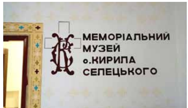
Рис. 2. Артоб'єкти – патерн, стрічкова композиція і логотип стінопису музею, 2016 р.