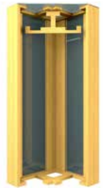
Рис. 1. Меморіальний музей о. Кирила Селецького, с. Цеблів. Проектна пропозиція: музейне експозиційне обладнання: ґабльоти для експонатів, фелонів (дерево, скло), 2016 р.