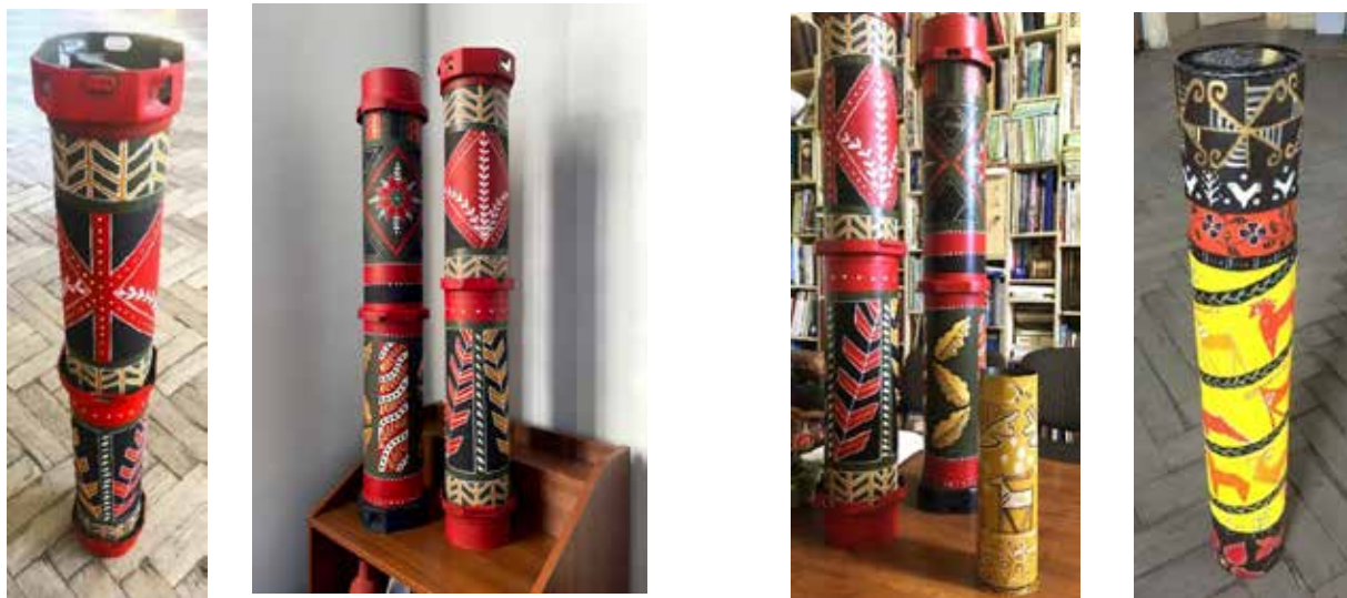
Рис. 3. Приклади рукотворних артоб'єктів «Світ писанки», 2024 р.

Продовжуючи активну інтеграцію дизайнерів Львова у суспільно важливі процеси країни під час війни, низка студентів другого курсу кафедри ДОА у позааудиторному режимі