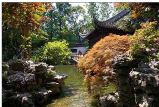
Рис. 2. Сад щастя (Ю Юань) у Шанхаї

Філософія Давнього Китаю ґрунтувалась на вічній боротьбі протилежностей, як результат: широке використання контрасту та нюансу у створенні ландшафтних композицій.