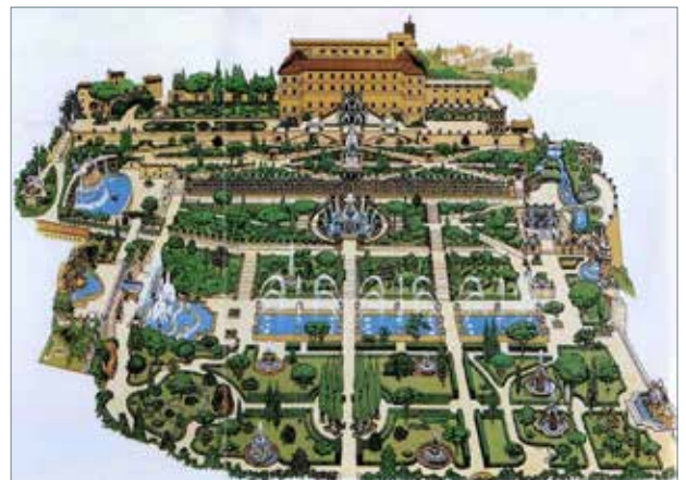
Рис. 6. Вілла д'Есте в Тіволі