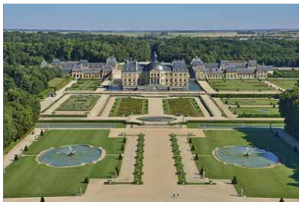
Рис. 7.2. Во-ле-Віконт