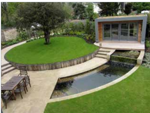
Рис. 9. Сад в стилі модернізм

Перший вдалий досвід застосування закону балансу/рівноваги можна відстежити в давніх садах східної цивілізації. Очевидно, базовою причиною вдалої гармонізації тих садів став тогочасний релігійно-філософський світогляд Китаю та Японії. Водночас з ними, митці Західної цивілізації досягали гармонії саду за рахунок застосування закону єдності та супідрядності з використанням найпростішого, але найдієвішого засобу гармонізації – симетрії. Симетрія залишалася основним прийомом митців доволі довгий час аж до виникнення класичних садів XVII століття (включно). Але вже в середньовічних фортечних та ренесансних садах ми можемо спостерігати перші ознаки свідомого застосування закону балансу/рівноваги. Творці тих садів навчилися узгоджувати масштаби садових просторів з відкритими просторами довкілля. Остаточне впровадження закону балансу/рівноваги в робочий інструментарій садових дизайнерів відбулося у XVIII столітті разом із створенням англійського саду.