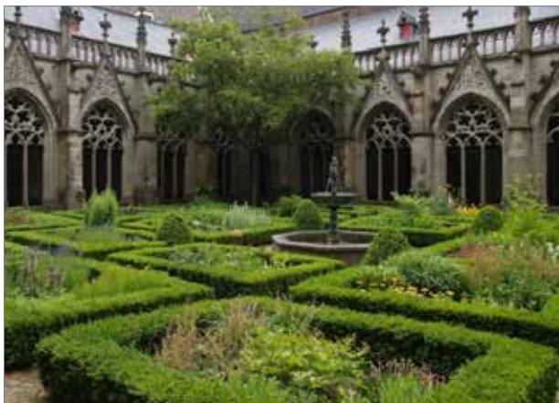
Рис. 5. Монастирський сад в Pandhof van de Dom

5. Активне використання партерів , в основі яких лежали правильні геометричні форми. Саме вони стали основним винаходом італійських садів доби Відродження.