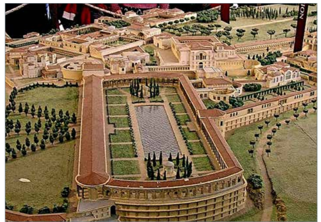
Рис. 4. Вілла Адріана в Тіволі

в історії розвитку приватних садів – епоха Середньовіччя.