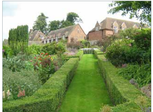
Рис. 8. Сад в замку Лідс

Вона відіграла ключову роль у розвитку тогочасних садів.