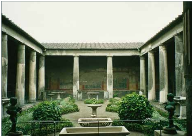
Рис. 3. Будинок Веттіїв в Помпеях