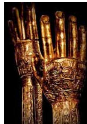
Рис. 2. Похоронні рукавички із золота, культура Чіму, Перу, 1200 р.

Татуювані індіанці та полінезійці, а пізніше європейці, які робили татуювання за кордоном, викликали великий інтерес на виставках, ярмарках та у цирках у Європі та США у XVIII–XIX ст.