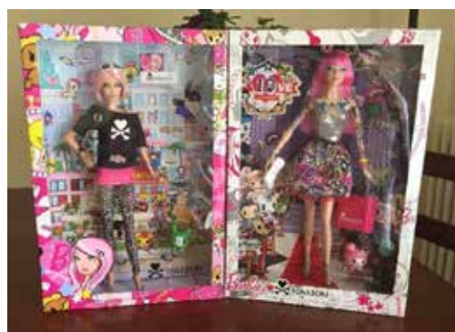
Рис. 4. Татуйована лялька Барбі, Mattel, 2011 р.

серед усіх класів людей і завдяки зростанню доступності татуювань.