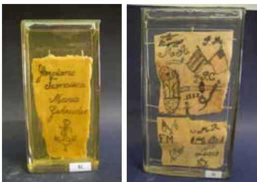
Рис. 3. Фрагмент людської шкіри, колекція INMLCF, 1923 р.