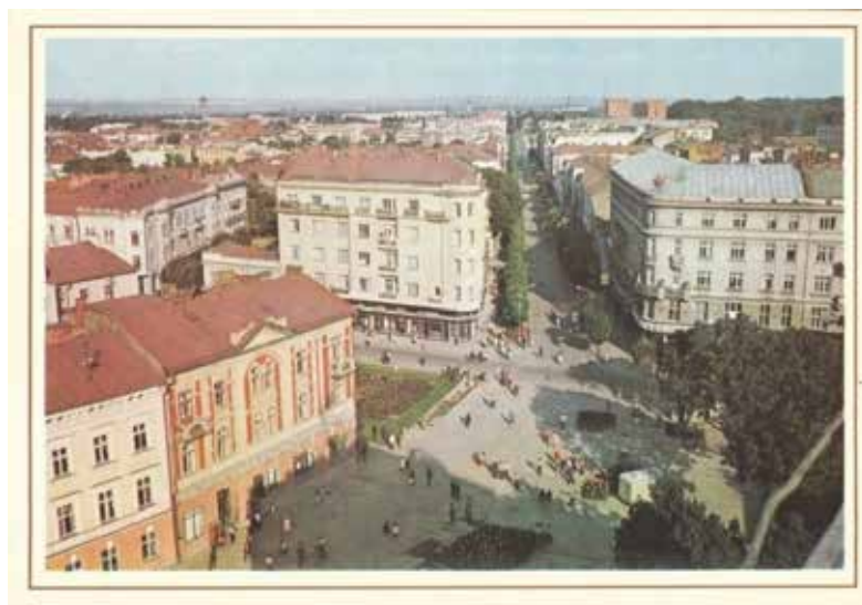
Рис. 10. Вулиця Незалежності (Радянська), 1990 р.