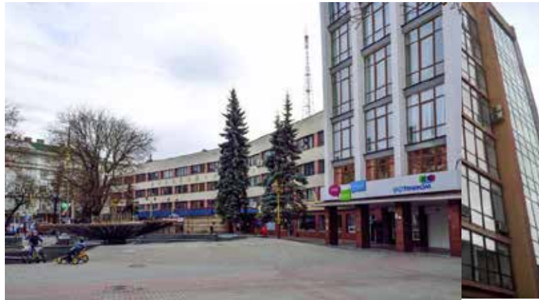
Рис. 9. Міжміська телефонна станція, 2016 р.