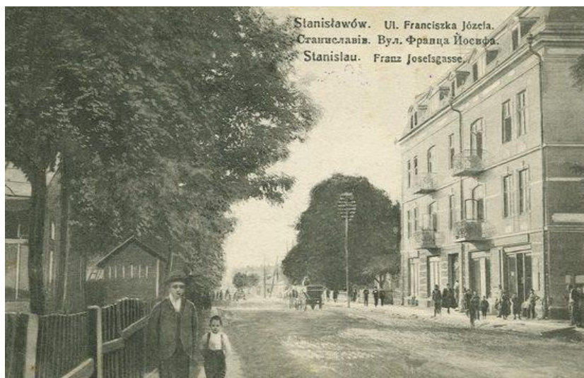
Рис. 4. Вулиця Франца Йосифа

Тоді ця ділянка сягала 100 м довжини, тому й отримала назву «Стометрівка», або «Сотка». Пізніше пішохідну зону подовжили. А от неформальна назва, яка прижилася