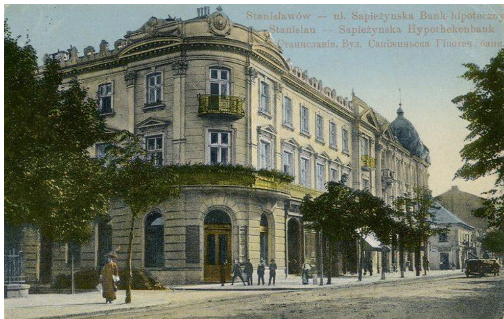
Рис. 3. Вулиця Сапіжинська

Власником новобудови був Міщанський банк, заснований у 1884 р. як «Товариство взаємного кредиту міщан у Станиславові» [7].