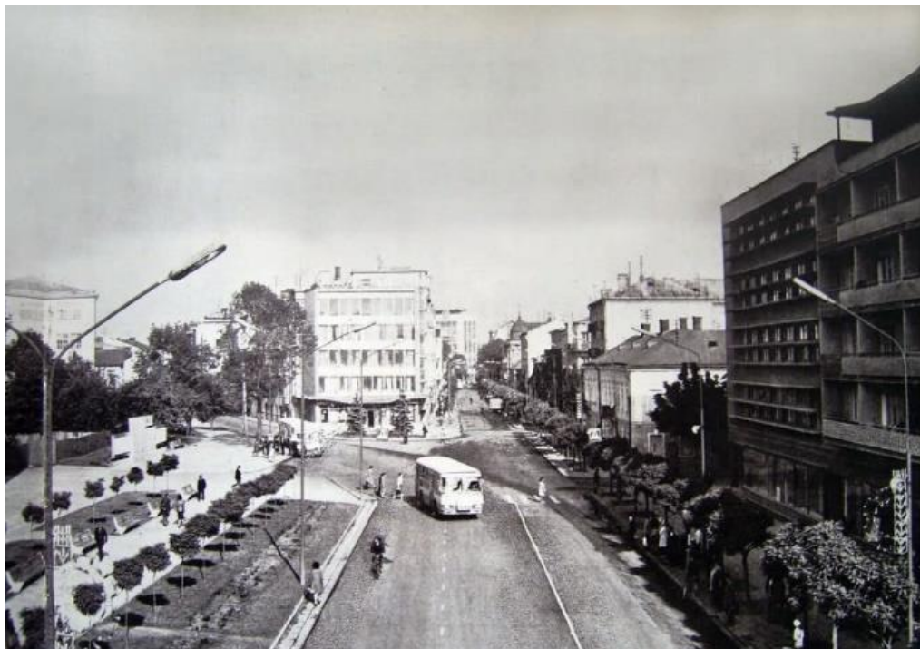
Рис. 6. Вул. Незалежності в 70-ті роки. Перехрестя Незалежності – Січових Стрільців в 70-ті роки. Усі дороги вимощені бруківкою

У конкурсі взяли участь: «Діпромiсто» (Київ), Івано-Франківська філія «Діпромiста», «Київ ЗНІЕП», «Київ НДІ містобудування», «Укрзахідцивільпроект», Київський художній інститут (архітектурний факультет). Переможцем визнано працю архітектурного факультету КХІ, на підставі якої в Івано-Франківській філії «Діпромiста» було