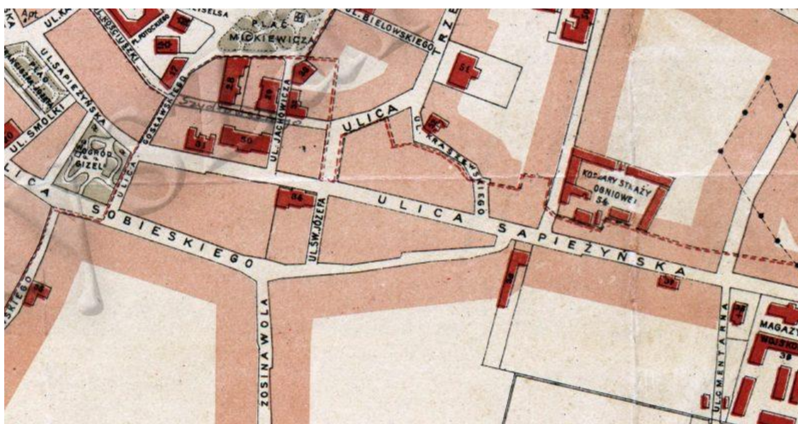
Рис. 1. Вулиця Сапїжинська 1869 р.

Найдавнішою кам'яницею є крайній правий будинок, що нині має адресу вул. Незалежності, 15. Його спорудили у 1900 р., про це свідчить напис на підлозі вестибюлю.