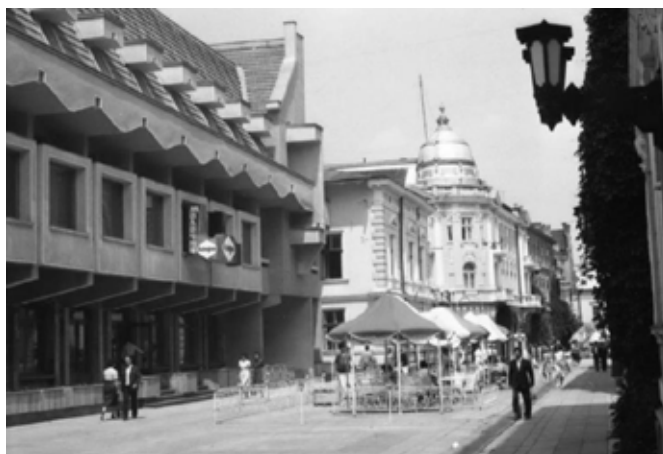
Рис. 5. «Молочне кафе», 1984 р.