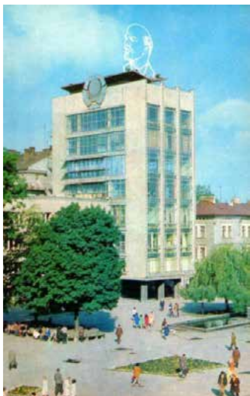
Рис. 8. Міжміська телефонна станція, 1968 р.

розроблено проєктні пропозиції щодо детального планування центральної частини міста [4].