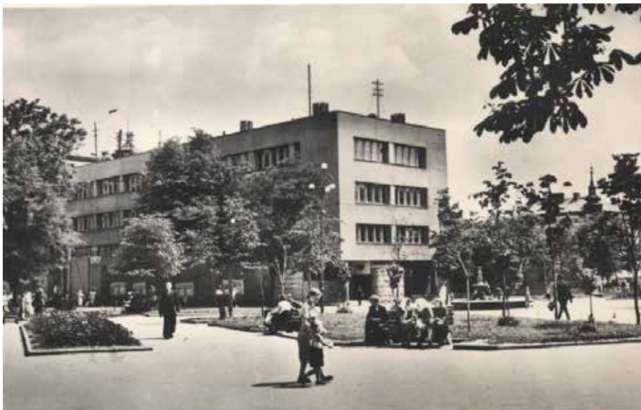
Рис. 7. Міжміська телефонна станція, 1966 р.