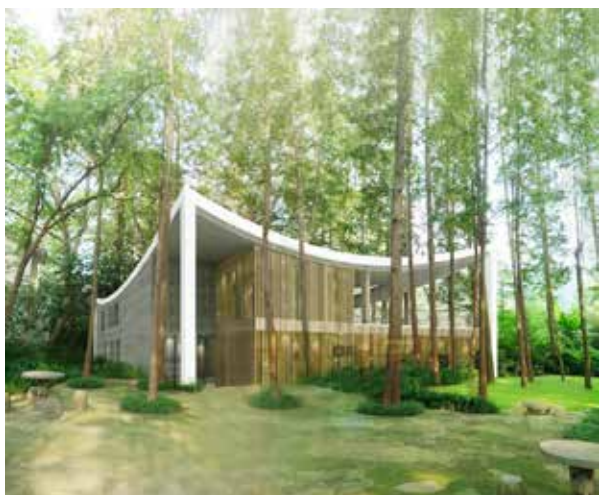
Рис. 6. Spruce Art Center фасад