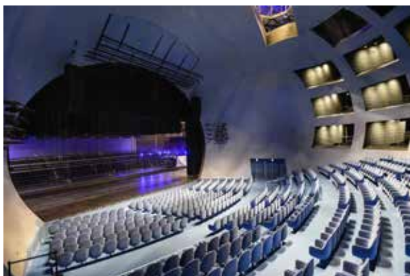
Рис. 8. Тайбейський центр виконавських мистецтв