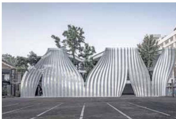
Рис. 3. Фасад, Арт-центр ІОМА