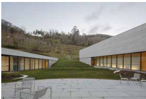
Рис. 4. Центр наскального мистецтва Кантабрії