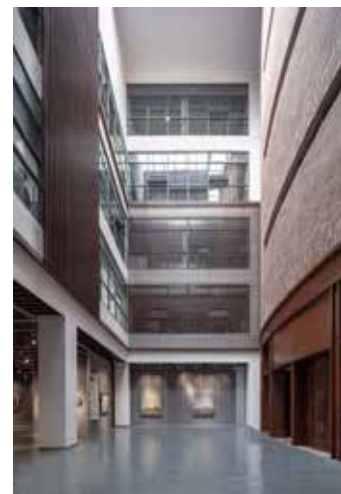
Рис. 1. Центр масового мистецтва Хуанші