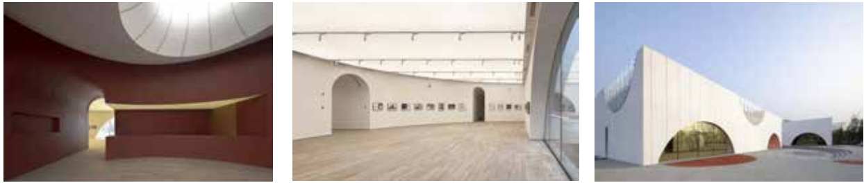
Рис. 9. Центр дитячої творчості озера Сінлун

дослідженнями. Що стосується вибору кольорів, це не одноманітний сіро-білий, а веселий простір з кольором, насиченістю та теплом. Тому, враховуючи супрематизм, обрано червоний як колір інтер'єру, який викликає ентузіазм і фантазію, синій дах як фантазія для ширяння в небі та велика біла основа, яка є відображенням невинності та простоти. Для функціональної циркуляції створено три потоки: відпочинок, виставка та офіс (рис. 9). А для функціонального планування виставковий простір і кавовий офіс розділені на два різні блоки, які розділяють простір для дітей і дорослих, залишаючи дітям унікальний, чистий і цікавий світ. Кільцеподібна основа та закрита будівля забезпечують дітям відчуття безпеки, прикрашаючи їх різними колами, художніми скульптурами, фонтанами, ігровими майданчиками тощо, щоб створити мистецьку атмосферу та залучити туристів [11].