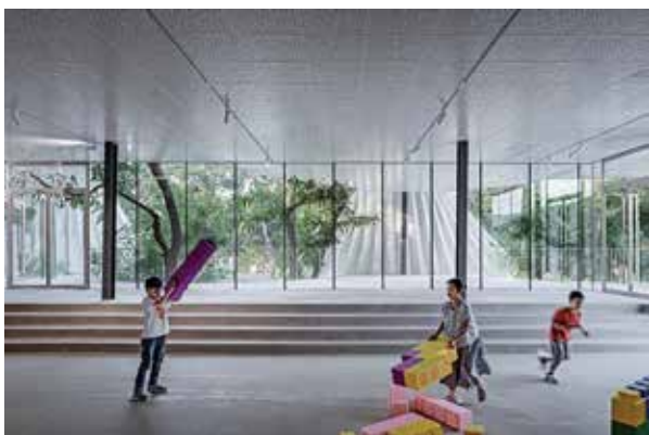
Рис. 2. Виставковий зал Арт-центр ІОМА

та обслуговування, виставкова зона та зона обмеженого доступу. Три блоки сформульовані й організовані навколо центрального двору, який розподіляє та з'єднує різні кімнати. Отриманий об'єм у формі «С» звернений до природного схилу ділянки, замикаючи будівлю та створюючи «зелений ярус». Таким чином, гора стає частиною проекту, стає головним героєм і артикуляційним елементом будівлі, запрошуючи відвідувача вийти на вулицю та діючи як продовження діяльності центру на свіжому повітрі. Конструктивно будівлю поділено на два блоки. Нижня частина вирішена бетонними стінами в зонах, що містять рельєф, тоді як фасади, що виходять на подвір'я та зону доступу, переважно засклені. На цій основі підтримується дах з вапняку, який з'єднує три об'єми разом, складається і перетворюється на частину фасаду, створюючи хроматичний контраст, масштаб і текстуру на висоті. Будівля інтегрується та вступає в діалог із навколишнім природним середовищем, встановлюючи зв'язок із рельєфом і розкладаючи свої об'єми, щоб адаптуватися до середовища [18].