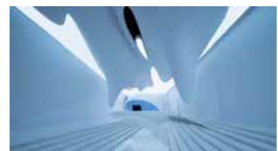
Рис. 5. Інтер'єр, Арт-центр M2