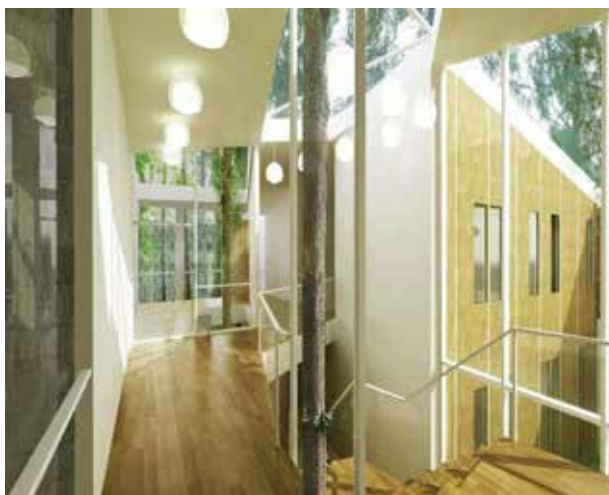
Рис. 7. Spruce Art Center інтер'єр