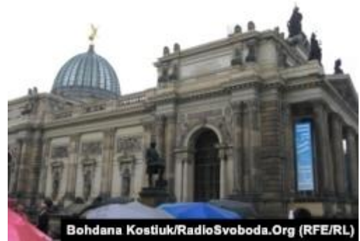
Рис. 14. Академія мистецтв, збудована у XVIII столітті, повністю відбудована на початку 2010 року

Тоді ж відкрила двері діячам культури й Академія мистецтв, відбудована за підтримки ЮНЕСКО та Євросоюзу (рис. 14) [1; 6; 7].