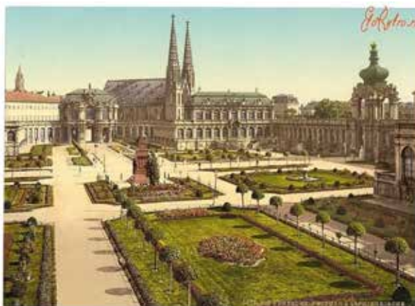
Рис. 1. Листівки старого Дрездена

захопити схід Німеччини, потрібно було знищити залізницю.