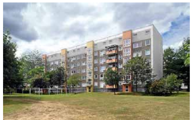
Рис. 7. Панельна будівля на Wilsdruffer Ring, 20, зведена на початку 1980-х. Під час реконструкції шостий поверх зробили нежитловим, добудували балкони

Спроби позбутися соціалістичного минулого мали значні результати: на відміну від Дрездена 1970-х, у сучасному місці зникли монументи, вулиці мають інші назви, а центр знову став бароковим. Головним ідеологом повернення стилю барокко на вулиці Дрездена був прем'єр-міністр Саксонії Курт Біденкопф. Він розраховував, що реконструкція, на яку витратили мільярди доларів, привабить у місто нових жителів.