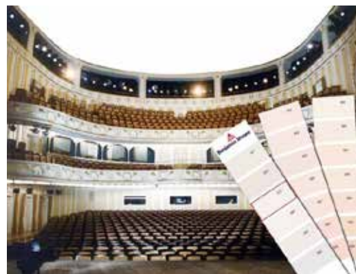
Рис. 8. Державний театр Дрездена на старій листівці (зверху), його руїни (посередині) та він же після відбудови (знизу)