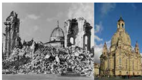
Рис. 12. Руїни собору Фрауенкірхе та його сучасний вигляд