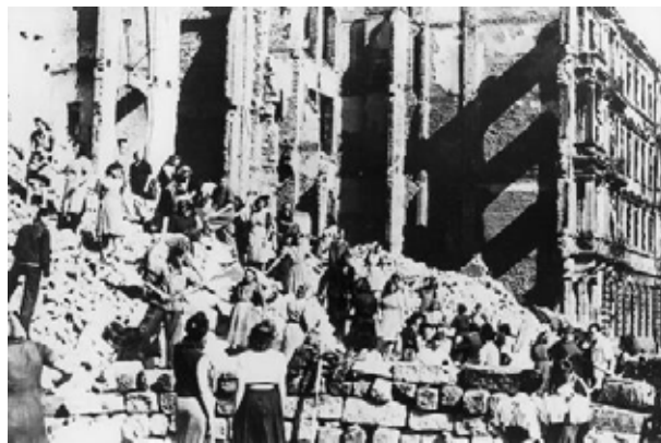
Рис. 3. Участь населення у розбиранні руїн Дрездена

Вже з перших днів ті жителі міста, які вціліли в бомбардуваннях, виходили працювати на розборі завалів. Збереглися знімки робіт, на яких видно, що працювали всі – і молодь, і зовсім старі, розчищаючи уламки без спеціального обладнання, цеглина за цеглиною. Займалися цим переважно жінки, вишикувавшись у довжелезні ланцюги біля розвалин, – чоловіки у цей час працювали на фабриках (рис. 3).