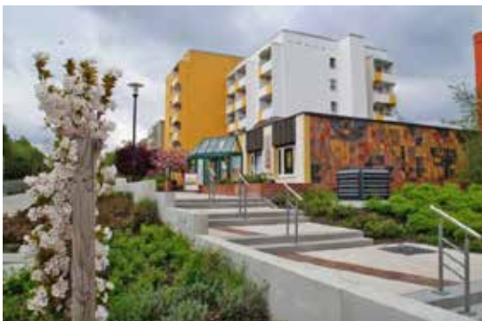
Рис. 6. Хатини Ніссена (зверху), вид з башти ратуші на площу Пірнайшер, 1972 р. (посередині) та житловий район Горбіц – найбільший масив з панельних будинків у Дрездені, збудований на південному сході міста у рамках програми житлового будівництва в 70-ті рр. ХХ ст. (знизу)

житла, а по-друге, як показав новітній досвід, панельки виявилися вдячним матеріалом для реновації, і сьогодні райони, побудовані в 70-х, аж ніяк не лякають. Крім того, після падіння Берлінської стіни німці почали модернізувати їх, перетворюючи на яскраве, сучасне та комфортне житло.