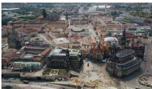
Рис. 13. Святкування завершення реконструкції Фрауенкірхе у 2005 році (зверху) та вид на центр Дрездена з дрона: у лівій частині – Фрауенкірхе, по центру – Палац культури (знизу)

Фрауенкірхе було проведено у 2005 р., а служби були поновлені у травні 2010 р.