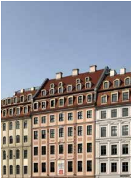
Рис. 5. Фонова забудова центральних районів Дрездена, характерна для II половини ХХ ст.

будівель, витриманих у стилі «сталінського ампіру». Дрезденський Альтмаркт було розширено на південь, щоб створити простір для масових демонстрацій.