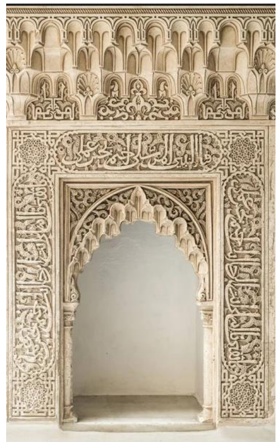
Рис. 13. Міхраб