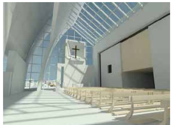
Рис. 28. Церква Милосердного Бога Отця. Рим

Проктування сакрального простору є складним і відповідальним завданням, яке поєднує архітектуру, символіку, релігійні практики та потреби віруючих. Кожен аспект – від символіки і розташування до використання матеріалів і комфорту – має велике значення для створення неповторного духовного досвіду. Проектування сакрального простору повинно враховувати потреби віруючих, створювати емоційну та духовну ауру, і бути гнучким для адаптації до змін. Шляхом об'єднання цих елементів можна створити особливий простір, який надихатиме людей і дозволить їм знайти спокій та зближення зі святим.