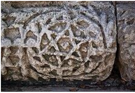
Шестикутна зірка на камені із синагоги в Капернаумі.