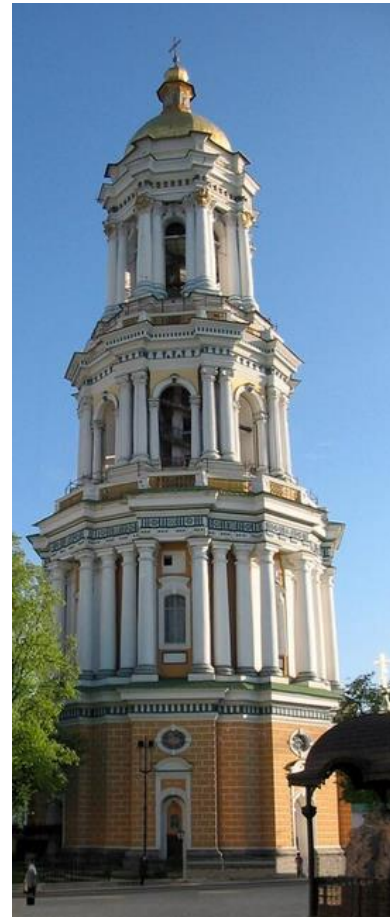
Велика Лаврська дзвіниця