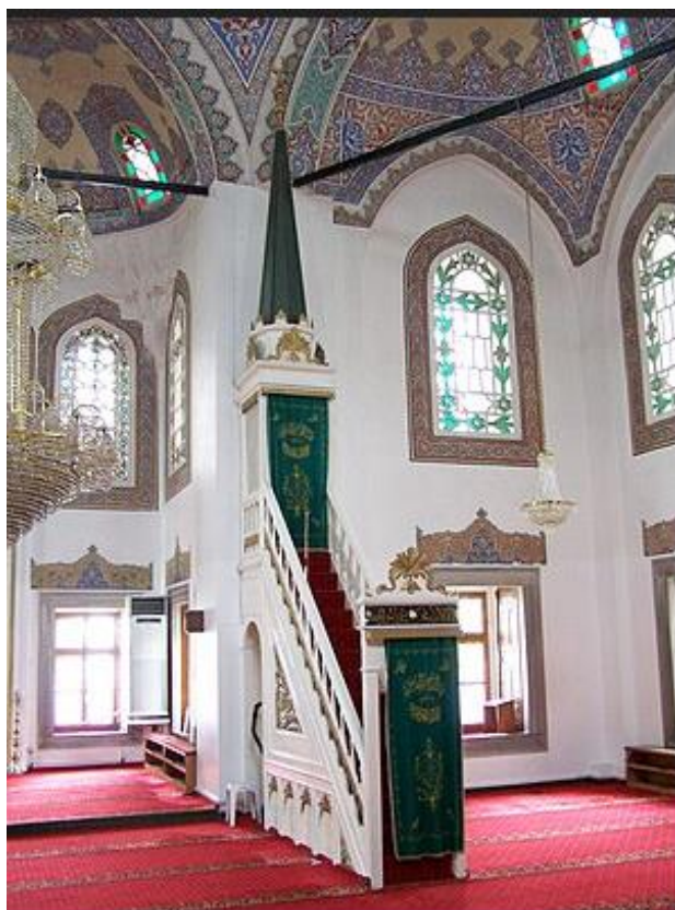
Рис. 14. Мінбар в мечеті Стамбула