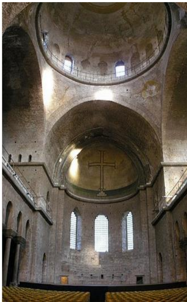
Рис. 7. Церква Святої Трини у Константинополі. 532 рік, перебудова після 740 року