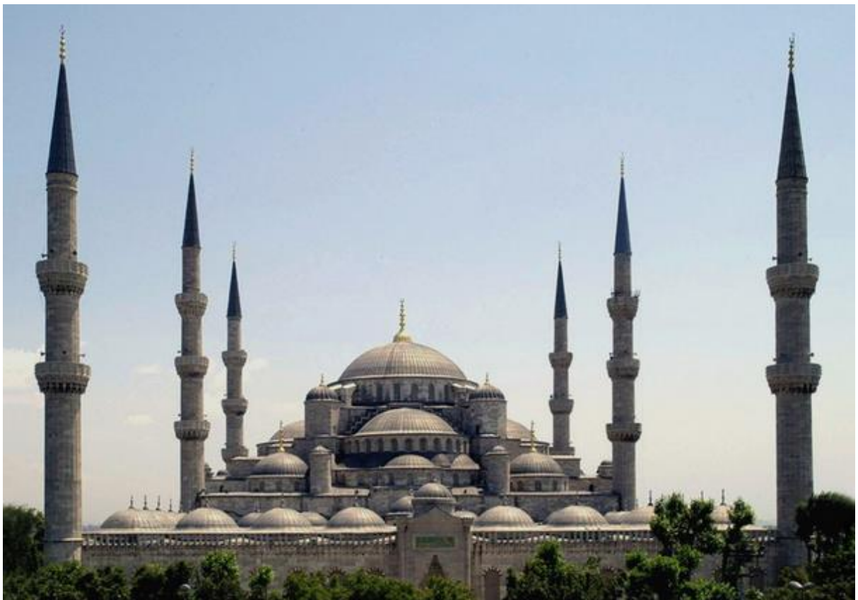
Рис. 9. Шість 6 мінаретів, Блакитна мечеть, Стамбул