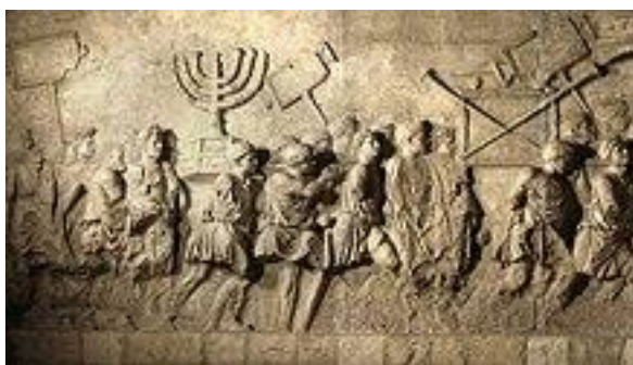
Рис. 21. Зображення на Арці Тита: бранці у процесії та храмові скарби, у тому числі менора

акустичні характеристики. Використання дерева, каменю або природних волокон створює зв'язок з природою та сприяє почуттю спокою та гармонії. Використання традиційних матеріалів, які мають значення для громади відображає культурну спадщину та цінності – це може бути місцевий камінь тощо. Що стосується колористики – застосування приглушених відтінків, таких як беж, сіро-блакитний або пастельні кольори, створює заспокійливу атмосферу та надає відвідувачу зануритися у духовне спілкування. Ретельно продумане освітлення, яке створюватиме особливе сприйняття сакрального простору та затишку