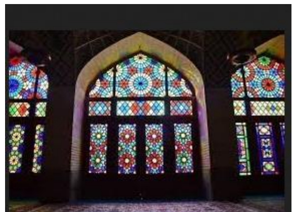
Рис. 25. Вітраж в мечеті

що проникає через вікна, на кольорове світло, створюючи неповторну атмосферу. Кожен колір має своє символічне значення, і відповідний вибір кольорів передає релігійні повідомлення та настрої. По-друге, вітражі можуть відтворювати релігійні