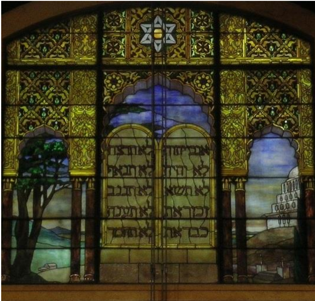
Центральна частина вітража (автор Тіффані) Луї Комфор Тіффані (Louis Comfort Tiffany (1848-1933) – найяскравіший представник вітражної справи стилю Ар Нуво.