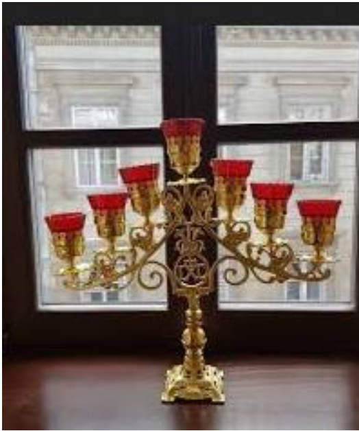
Рис. 22. Семисвічник в християнстві