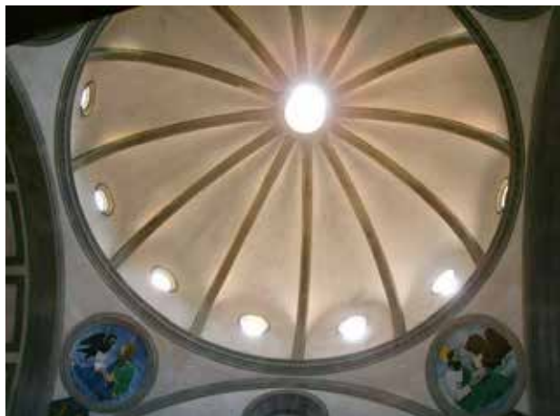
Рис. 5. Купол-паросолька, Капела Паці, храм Санта-Кроче. Флоренція

Вівтар або священне місце є центральною точкою храму. Це місце, де здійснюються релігійні обряди, молитви, жертвоприношення або зустріч з божественним. Вівтар може мати символічні предмети або символи, пов'язані з релігійними переконаннями, і він може слугувати як точка збереження святості або з'єднання зі світлом. В східній церкві святилище відділяється