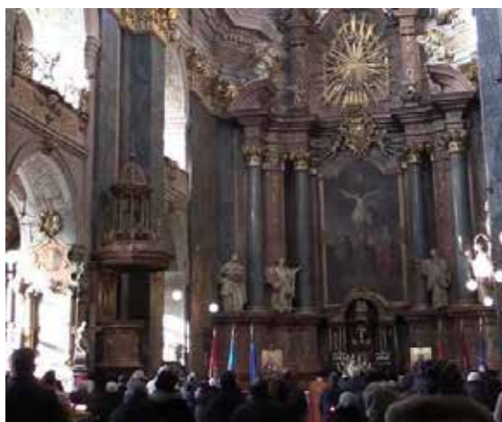
Рис. 15. Катедра, гарнізонний храм, м. Львів