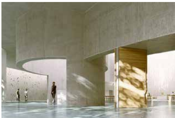
Рис. 27. Католицька церква. Сінгапур

Сакральний простір має велике значення в релігійних та духовних традиціях різних культур. З плином часу суспільство змінюється, традиції еволюціонують, і з'являється потреба у нових формах вираження сакрального змісту [14] (рис. 27, 28). Зі зростанням міжкультурних контактів і глобалізацією суспільства змінюються уявлення про сакральний простір. Традиційні форми вираження, такі як храми, святині і молитовні будинки, залишаються важливими, але з'являються й інші способи відображення сакрального змісту. Традиційні форми можна поєднати з сучасними матеріалами та технологіями. Наприклад, створення сучасної версії куполів, арок, стовпів чи розписів, з використанням нових матеріалів, таких як скло, метал або бетон. Це дозволяє створити враження сучасності, але зберегти зв'язок з традиційними формами [15].