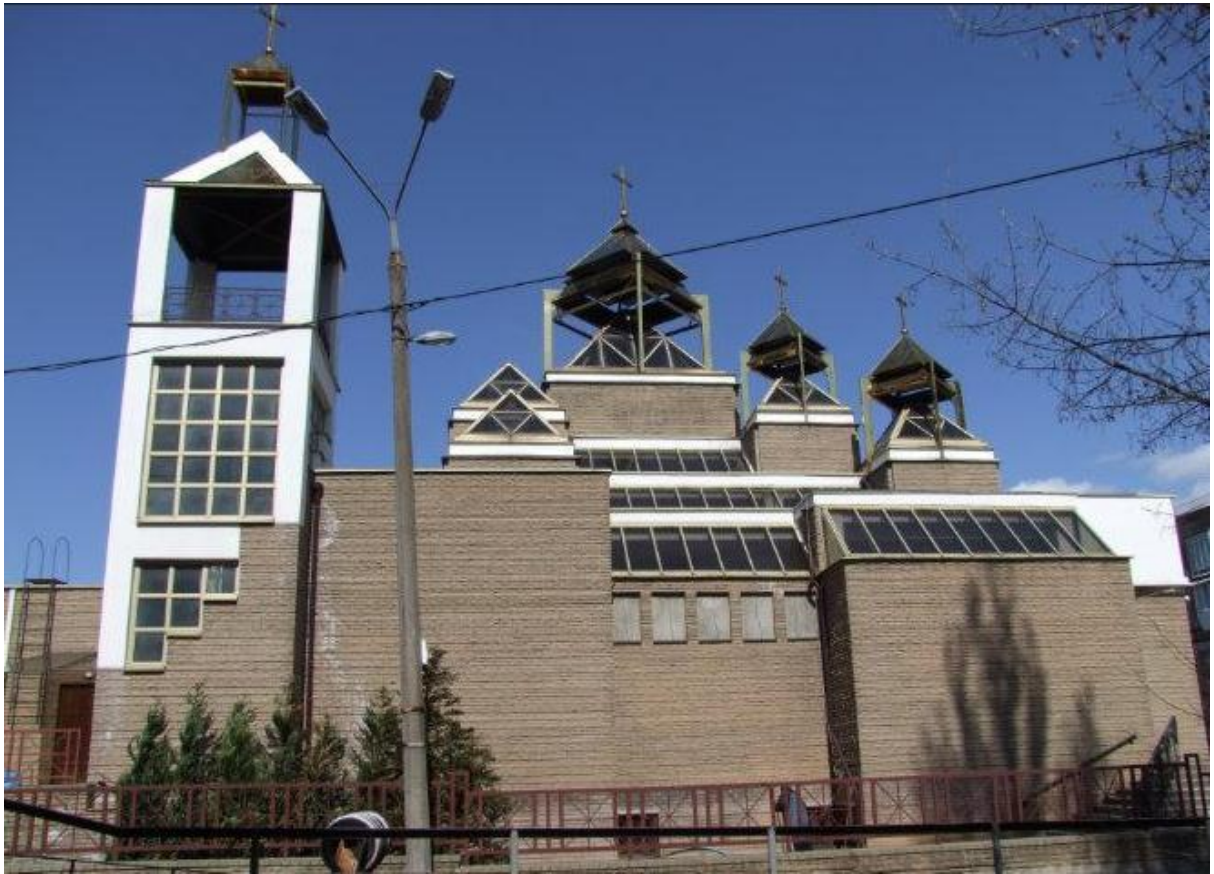
Рис. 8. Храм св Василя Великого, м. Київ