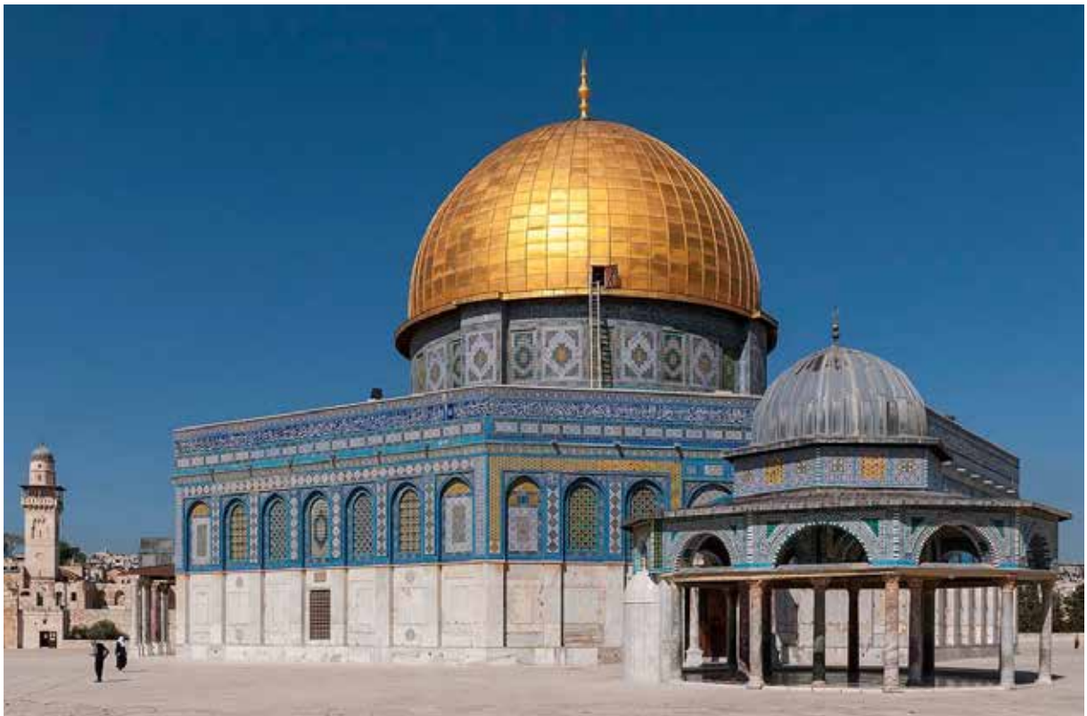
Рис. 4. Купол Скелі на Храмовій горі Єрусалим

Фундаментний камінь виступає на 1,5 метра від підлоги. Навколо фундаментного