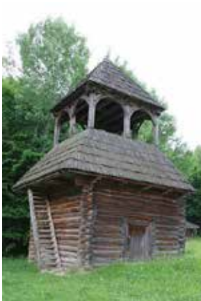
Дзвіниця з села Великий Жолудський Володимирецького району Рівненської області. Музей у Пирогові