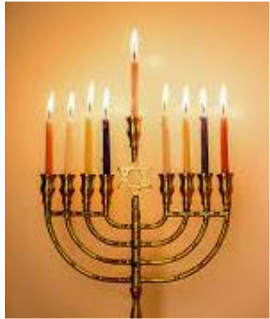
Рис. 23. Ханукальні свічки