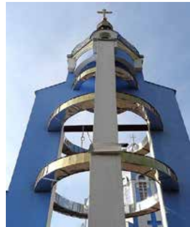
Сучасна дзвіниця у Вінниці