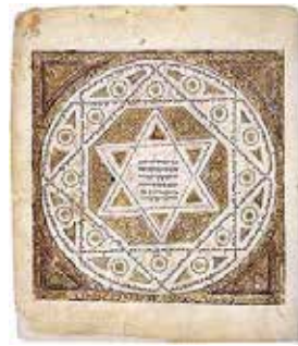
Маген Давид на найдавнішій повністю вцілілій копії масоретського тексту Тори, 1008 год