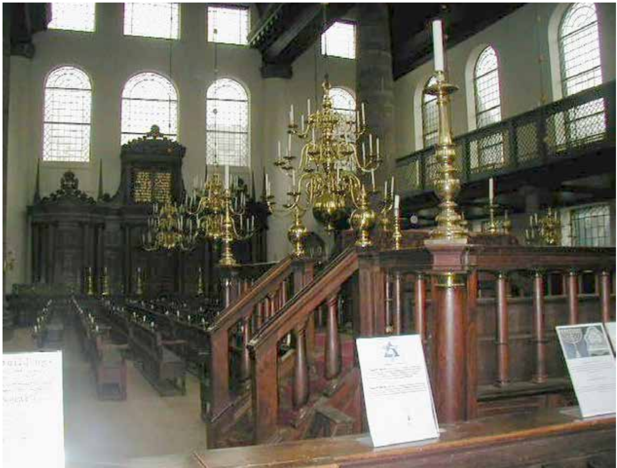
Рис. 17. Бема португальської синагоги, Амстердам

простору застосовують для створення особливої атмосфери поклоніння або звернення до внутрішнього світла. У християнських церквах свічки мають важливе символічне значення і використовуються в різних церемоніях та богослужіннях. У мечеті використання свічок не є типовою практикою. Мусульмани переважно спрямовуються на молитву і використовують природне освітлення мечеті. В юдаїзмі свічки грають важливу роль в релігійних обрядах і святкових подіях. Особливі свічки, відомі як «шабатні свічки», запалюються перед початком Шабату (суботи) і символізують світло і благословення. Менора ханукальні свічки (рис. 18, 19, 20, 21).