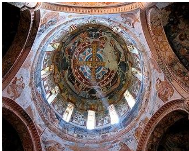
Рис. 6. Шестигранний купол. Собор Нікорцмінда. 1010–1014 гг. Внутрішній вигляд купола.