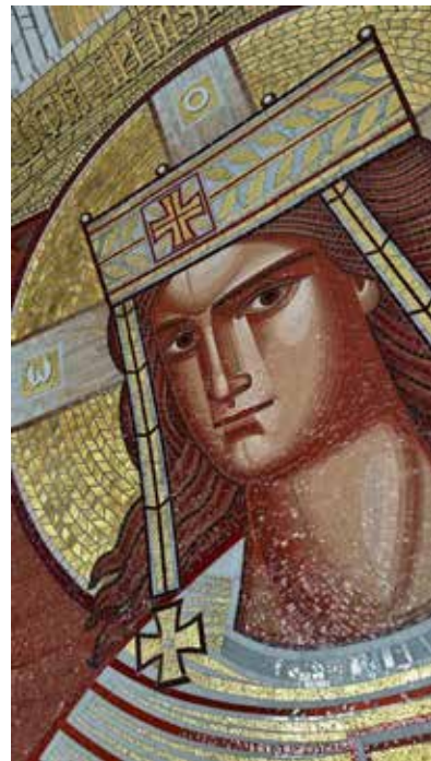
Рис. 1. Храм Святої Софії-Премудрості Божої. м. Львів, 2022