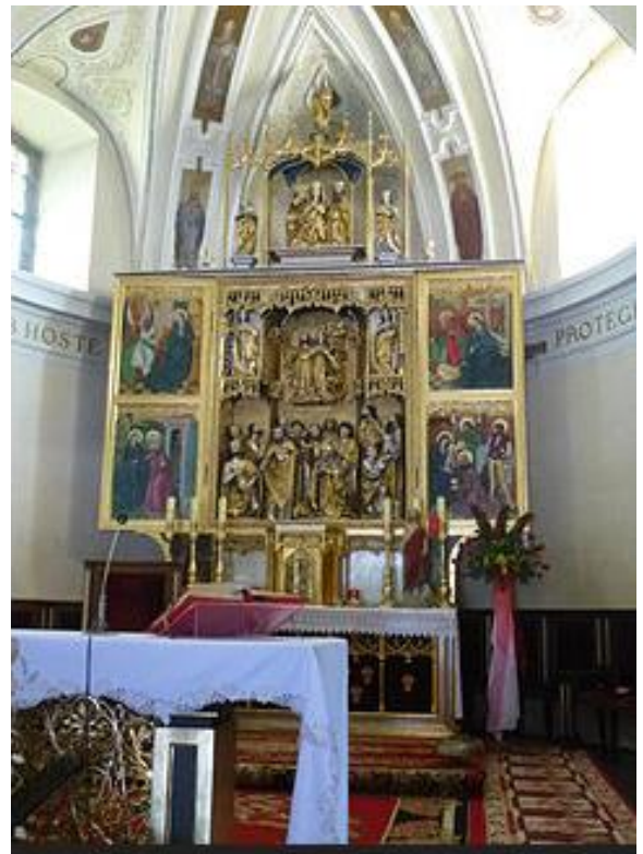
Рис. 12. Майстерня Файта Штосса (?), головний вівтар 1491 р. у костелі в Кшонжницях Великих