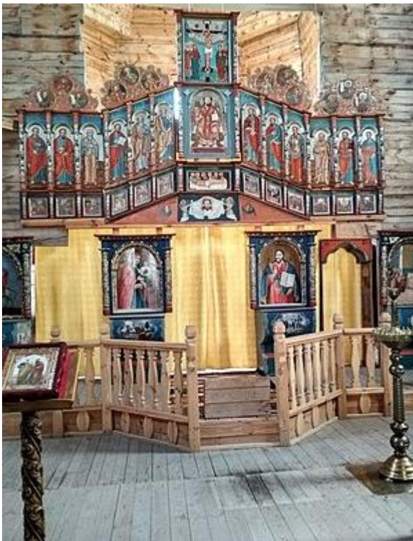
Рис. 11. Вівтар храму на о. Хортиця

Кафедра або катедра (від грец. καθέδρα , лат. cathedra ) – у християнстві почесне крісло в храмі, призначене для єпископа. Синоніми – горішне місце,