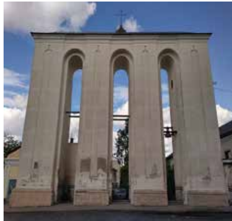
Дзвіниця колишнього Собору Святої Трійці в Луцьку