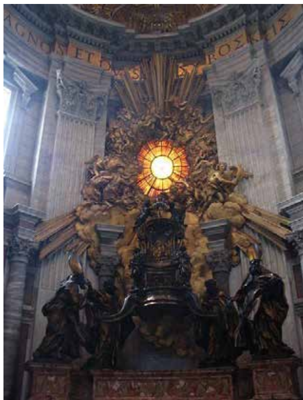
Рис. 16. Собор св. Петра, Рим