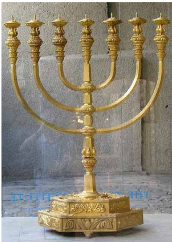
Рис. 18. Реконструкція Менори, призначеної для використання у Третьому Храмі