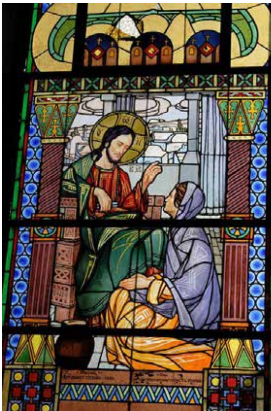
Рис. 24. М. Сосенко. Вітраж із церкви с. Підберізці. 1910