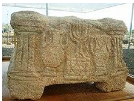
Рис. 20. Камінь із зображенням менори із синагоги в Магдалі. Датовано періодом до руйнування Храма