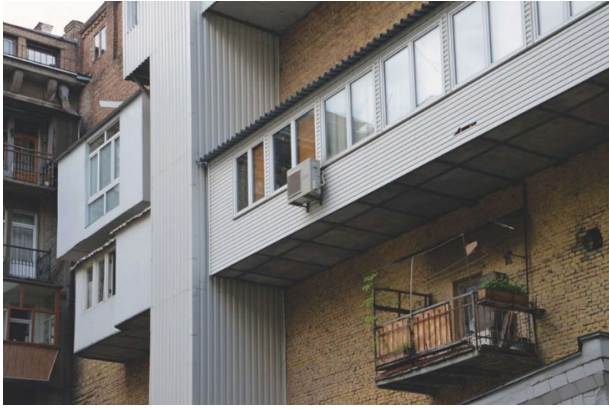
Рис. 7. Прибудова балконів у житловому будинку, м. Київ, Україна