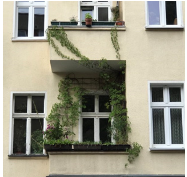
Рис. 2. Використання витких рослин в озелененні балконів. Берлін, Німеччина