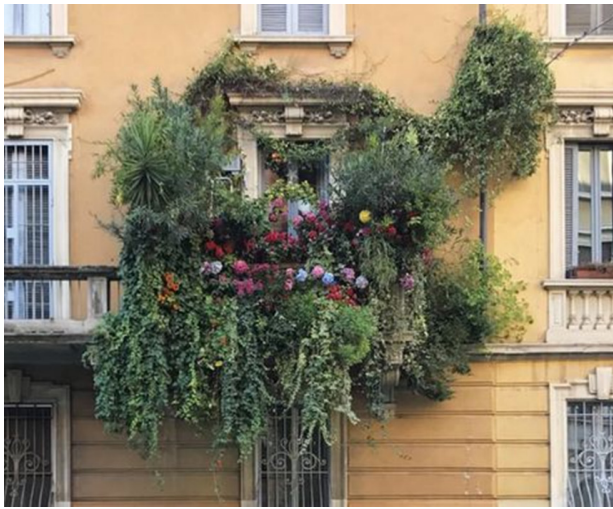
Рис. 1. Озеленення балкону у Берліні, Німеччина