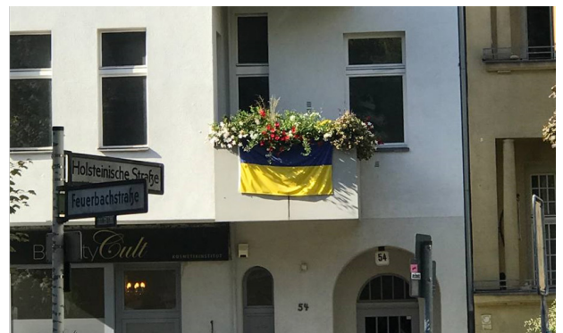
Рис. 6. Оформлення балкону ампельними квітковими рослинами. Берлін, Німеччина