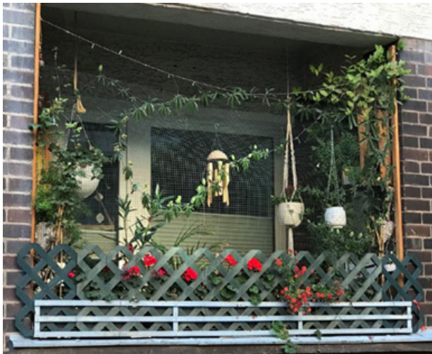
Рис. 3. Оформлення балкону підвісними рослинами. Берлін, Німеччина