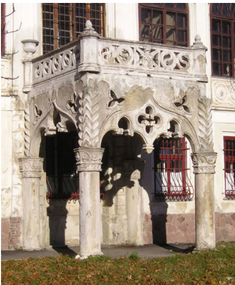
Рис. 9. Готичний балкон палацу Туркулів-Комелло, м. Львів, Україна