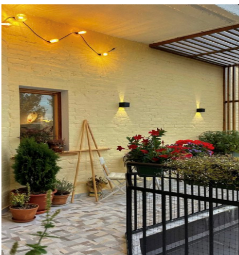
Рис. 11. Сучасний балкон, м. Львів, Україна