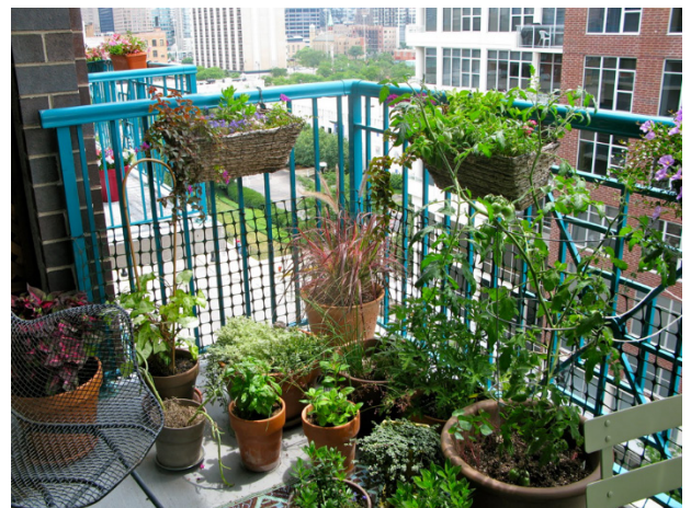
Рис. 4. Використання духмяних трав в озелененні балконів. Гамбург, Німеччина