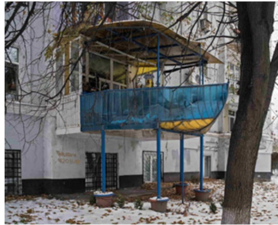
Рис. 8. Дизайн балкону у спальному районі, м. Київ, Україна