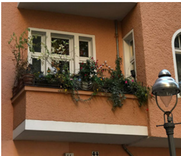
Рис. 5. Використання дерев'янистих та трав'янистих багаторічних рослин в озелененні балконів. Берлін, Німеччина