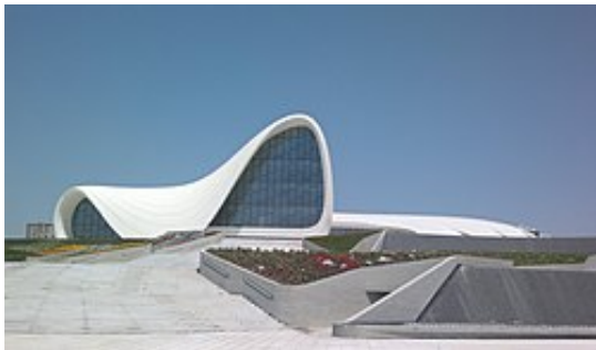
Рис. 1. Найкраща будівля в світі в 2014 році – Центр Гейдара Алієва (м. Баку, Азербайджан), стиль – параметризм, архітектор – Заха Хадід

свіжий і незвичайний архітектурний стиль, який з роками тільки закріплював власні позиції в усьому світі (рис. 1).