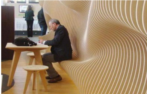
Рис. 6. Приклад параметричного дизайну в одному з музеїв світу

Наприклад, стіна може одночасно служити як лавкою, так і стільцем. А столик, що виконаний у цьому стилі, може використовуватися за допомогою декількох ніш як невелика етажерка, яка сформувалася внаслідок переплетення ліній (рис. 6).