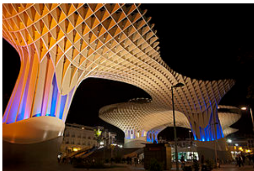
Рис. 2. Одна з найбільших дерев'яних конструкцій в світі – «Метрополь Парасоль» (м. Севілья, Іспанія), архітектор – Юрген Майер

Потрібно відзначити, що цей стиль набув популярності з розвитком передових параметричних дизайнерських систем. Потрібно відмітити, що на сьогодні він є найважливішим і домінуючим стилем в сучасній авангардистській практиці, вимагаючи масштабності у всіх сферах починаючи від архітектури і дизайну інтер'єру, до великомасштабного міського громадського дизайну. При створенні та проектуванні параметричної архітектури використовують нові сучасні комп'ютерні програми, які дозволяють не тільки параметрично моделювати, але і розробляти математичні алгоритми, логічні умови, які дозволяють знайти оптимальне рішення задачі в автоматичному режимі, розширити можливості при створенні складних форм і структур (рис. 2).