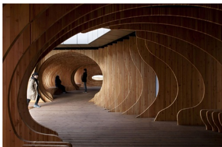
Рис. 4. «Лунка для відпочинку» в Сеульському університеті (м. Сеул, Південна Корея)

Часто дизайнери в інтер'єрі використовують параметризм в оздобленні стелі, стін, меблів та елементів декору. При цьому для інтер'єрів використовують переважно природні матеріали – дерево і камінь, які у своєму поєднанні створюють у людини відчуття комфорту й усамітнення, допомагають сховатися від суєти великого гамірного міста (рис. 4).