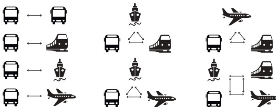
Рис. 4. Класифікація ПТХ за видами пересадок, що реалізуються

1. Наземний площинний ПТХ. Некапітальний ПТХ може бути лише площинним і лише наземним. Вони важливі, оскільки саме вони формують вигляд переважної кількості транспортно-пересадочних вузлів і великих