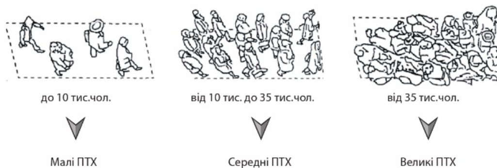
Рис. 2. Класифікація ПТХ за величиною пасажиропотоку