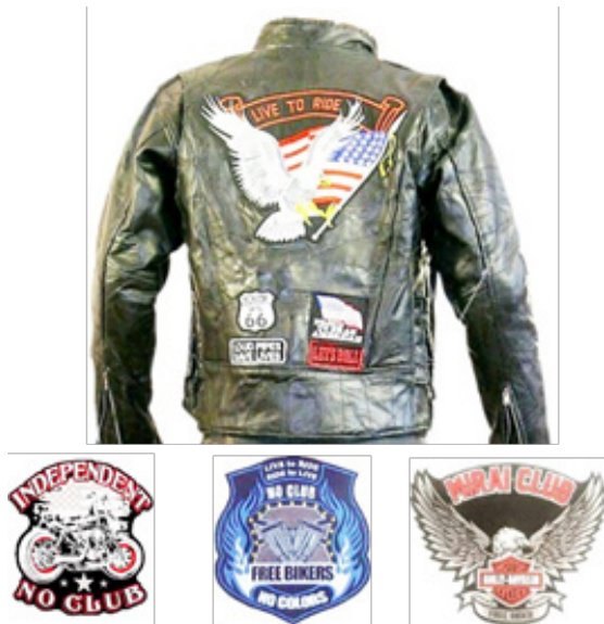
Рис. 3. Варіанти нашивок для «косух» із використанням екологічних матеріалів

також мають властивість світитися в ультрафіолеті та одночасно із цим ще і заряджатися.