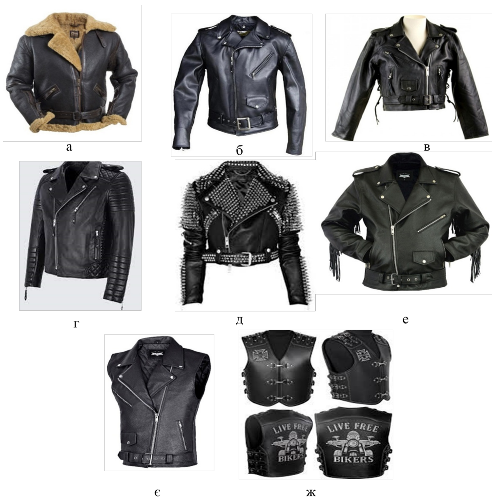
Рис. 1. Основні стильові типи байкерських курток «косух»

В дизайні «косухи» присутні налокитники та наплічники з міцнішої шкіри, що в поєднанні зі шкіряними штанами із наколінниками, дає дуже непоганий захист при падіннях з байка (рис. 1г). Дизайн такого виду байкерської куртки відрізняється від інших характерним несиметричним розміщенням блискавки - на грудях куртка має велике нахльстування шкіри для того, щоб груди і шию менше продувало під час їзди. Класичний дизайн байкерської «косухи» включає три кишені на блискавці та маленьку кишеньку з клапаном на кнопці спереду (рис. 1е). Складки з обох боків спини служать для свободи руху. Багато курток мають шнурівки з боків для регулювання розміру, хоча в оригінальній моделі її не було.