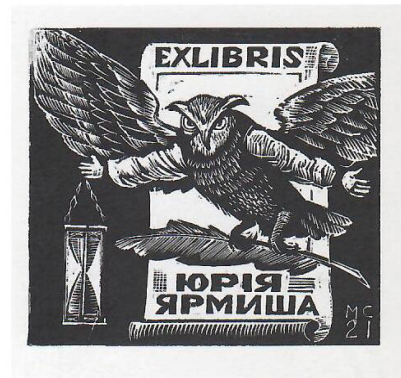
Рис. 1. Екслібрис Юрія Ярмиша

бриса. Стилізований образ чорного kota в окулярах і з краваткою-метеликом (гумор) наштовхує на думку, що це клуб розумників. Хвиляста пишнота рослинного декору гармонійно поєднує всі елементи екслібриса.