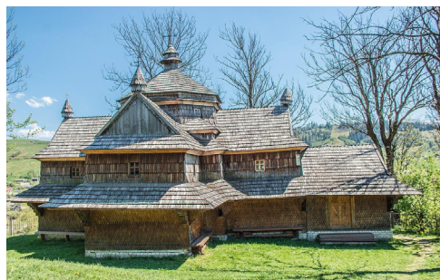
Рис. 6. Церква Вознесіння Господнього (1824) і дзвіниця (1813) в Ясіні

d. Карл Брюллов "Дівчина, що збирає виноград в околицях Неаполя"