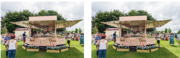
4. Зона відпочинку (Harlow carr, Tatton Park)