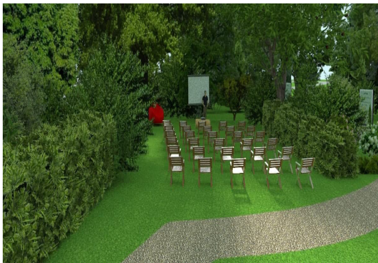
2. Зона конференцій