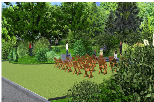
3. Зона урочистостей