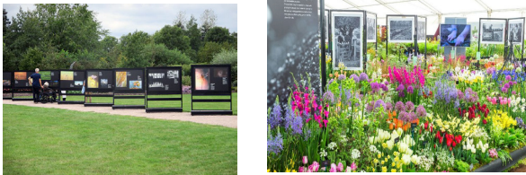
2. Зона реклами, повідомлень (Hyde Hall, Malvern)