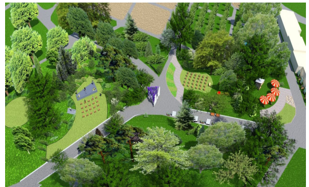
5. Вид з висоти пташиного польоту