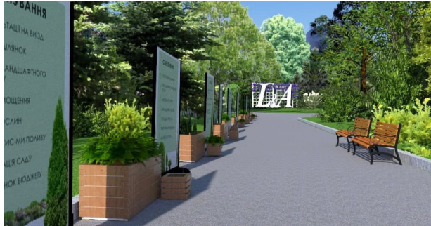
1. Зони реклами та логотипу

вих зон, таких як павільйони, в яких є можливість представлення великої кількості сортових рослин та предметів садової культури (на прикладі Chelsea), та зони продажу, проте у випадку ботанічного саду ім. О.Фоміна цей виставковий простір можна розмістити на вхідній частині.