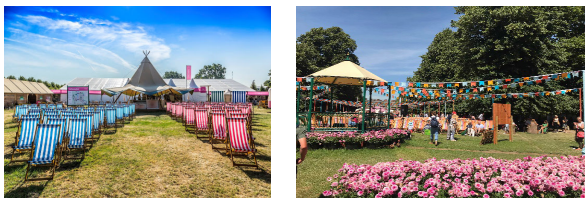
3. Зона конференцій, симпозіумів (Hampton court palace)