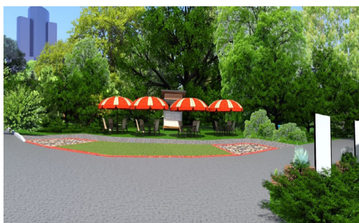
4. Зона перепочинку (кава-брейк)