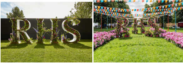
1. Зона логотипу виставки (Chelsea, Harlow carr)

moor, Hampton court palace, Chatsworth, можна виділити такі особливості та основні правила створення важливих зон та розміщення додаткових об'єктів благоустрою (рис.1):