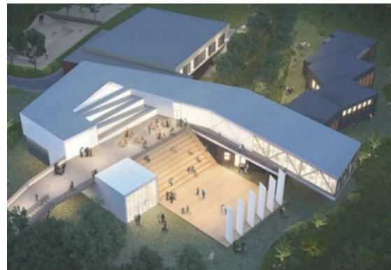
Рис. 5. Інноваційний культурний центр в Калузі.

Соціальний запит був вирішений як відображення ідеї вузла перетинання стрічок, що зв'язує освітню та громадську функції. Таке об'ємно-планувальне рішення дозволило архітекторам чітко розмежувати принципово різні характери діяльності, але в той же час дало можливість благоустрою вуличного простору, не тільки органічно включеного в існуючий ландшафт, а й надає можливості для активної діяльності молоді. У містобудівному сенсі будівля стає мотиваційним простором культурного життя громадян, в якому співзвучно з'єднуються місця для проведення міських заходів, а також можливості для активного проведення вільного часу у вигляді паркуру та скейтборду [3].