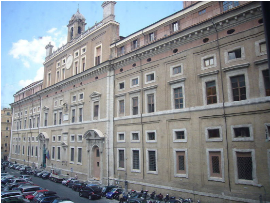
Рис. 1. Будівля Римської колегії, Рим, Італія.

клуби стали прототипами установ дворянських станових зборів в Казані на початку 19 століття. Їх архітектура формується на основі інтер'єрів замиського особняка з розширеними дозвільними і видовищними функціями, що відмінно підкреслює статус учасників таких клубів [3, 13].