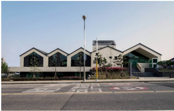
Рис. 3. Молодіжний центр «Chilbo», Сувон, Південна Корея.

Нетипове вирішення архітектурно-планувальною організацією простору для підлітків можна відмітити молодіжний центр «Hua Fai» (рис.4), розташований за кілька кілометрів від тайсько-бірманського кордону. Дизайнерське вирішення молодіжного центру порушує традиційні конструкції таких установ, які максимізують корисність, мало враховуючи складні соціальні потреби молоді, що мешкає в цих просторах. Саме трикутна структура будівель, які розміщені хаотично на території центру та каскадні вертикальні сади підкреслюють природні особливості місця забудови [9].