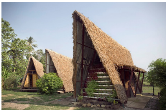
Рис. 4. Молодіжний центр «Hua Fai», Пхра Тхат Пхра Даєнг, Таїланд

Аналіз архітектурного досвіду розглядає трансформацію ідеї молодіжного простору через зміну об'ємно-просторового типу архітектурної форми, тісно пов'язаного з підлітковим потенціалом міського соціуму, що володіє інноваційно-креативними компетенціями.