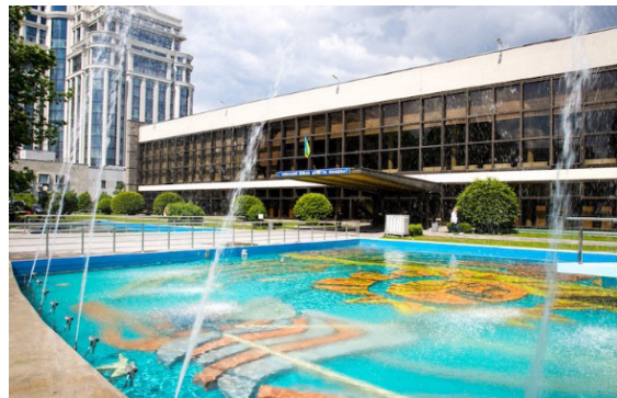
Рис. 2. Київський палац дітей та юнацтва, Київ, Україна.

СРСР [5]. Будівля має 3 поверхи, призначена для відвідування молоді різних гуртків віком від 5 до 21 років. Навчання проводилось в 200 напрямках, черпаючи знання і вміння по 186-ти різних спеціальностей творчого і технічного характеру. Будівля повністю виправдала свою функціональну здібність для дітей та підлітків, продовжуючи розвивати сучасну молодь в творчому аспекті, але на сьогоднішній день цього стало недостатньо [5, 19].