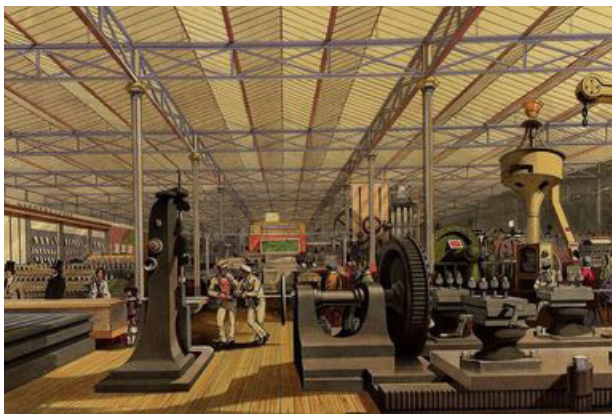
Рис.5. Промислові товари і вироби.

Виставка 1851 р. продемонструвала бурхливий розвиток британської промисловості і сповістила про настання ери британського панування на значній частині планети. Не буде перебільшенням сказати, що Виставка свідчила про бурхливий перетворенні всього британського суспільства.