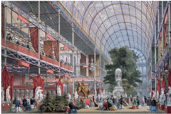
Рис.4. Велика виставка 1851р.

Колонії переважно виступали разом з метрополіями. Тематика виставки складалася з чотирьох великих розділів, поділених на більш дрібні класи (всього 31):