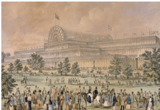
Рис.1. Відкриття Великої міжнародної виставки 1851р

Велика виставка 1851 в Лондоні, проведена в Кришталевому палаці (рис.1.).