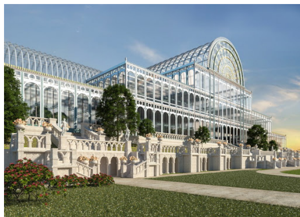
Рис.3. Кришталевий палац.

Експонати Англії — машини та товари займали на виставці більше місця, ніж вироби всіх інших країн, разом узятих.