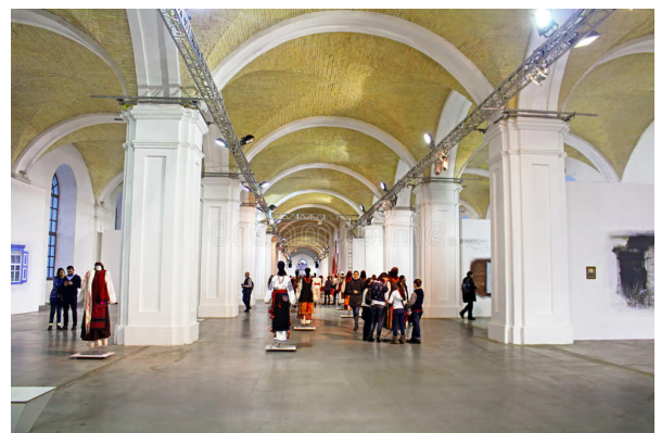
Рис. 1. Арт-музей Арсенал в Києві

Важливо щоб внутрішній простір будівлі, її архітектура були «налаштовані» на проведення різноманітних арт-івентів, таких як статичні виставки, покази фільмів, інтерактивні творчі події, конкурси та інших (Рис. 1,2).