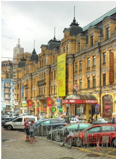
Рис. 4. Будівля PinchukArtCentre

Через це куратори змушені змінювати кількість задіяних приміщень залежно від випадку. Висота приміщень є фіксованою. На шостому поверсі центру знаходяться зали video-lounge та кафе, а також робочий простір кураторів. Загальна площа арт-центру становить понад 3000 м 2 [4].