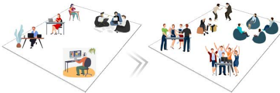
Рис. 2. Процеси як чинник адаптації середовища (причина адаптації або подразник)