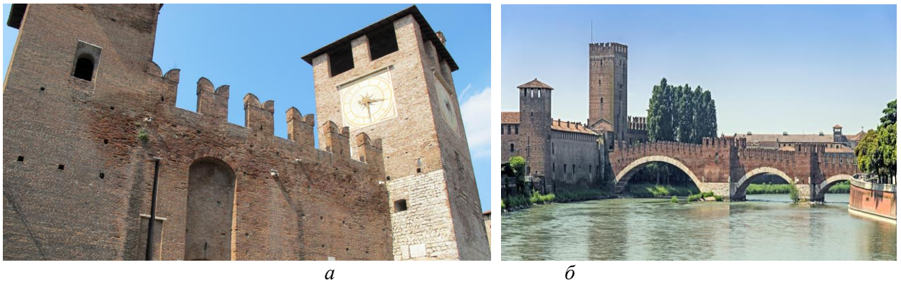
Рис.2. а – Кастельвеккьо; б – Середньовічний міст Скалігерів.