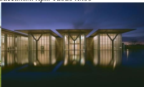
Рис. 6. Музей ім. Кімбела, Форт-Ворт, Техас. Арх. Луїс Кан Рис. 7. Музей сучасного мистецтва, Форт-Ворт, Техас, 2002 Арх. Т. Андо