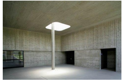
Рис.8. Кадзе-Но-Ока в Накацу, Японія, 1996. Арх. Ф. Макі

Висновок. Отже, мінімалізм – це стиль простоти, в якому нема нічого зайвого, а головними є простір та світло. Він став продовженням модернізму, але зберігає свої стилеві ознаки. В мінімалізмі використовуються, як правило, натуральні або високотехнологічні матеріали. Завдяки великим поверхням скла будівля стає прозорою, «нематеріальною» і не перекриває собою навколишнє середовище. Таким чином, різниця між модернізмом та мінімалізмом в концепції зв'язку з природою полягає в тому, що перший забирає природу в дім («сади на даху»), а другий відкриває інтер'єр назовні за рахунок скляних поверхонь. Концепція єдиного простору в мінімалізмі відображається у вільному плануванні та зв'язку з природою.