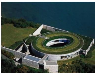
Рис. 5. Музей сучасного мистецтва на Наосімі, 1995. Загальний вигляд комплексу. Дворик з басейном. Арх. Тадао Андо