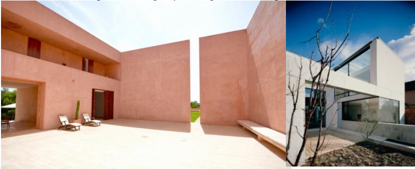
Рис. 3 Будинок Нойендорфа, Майорка, 1989.Арх. Джон Паусон