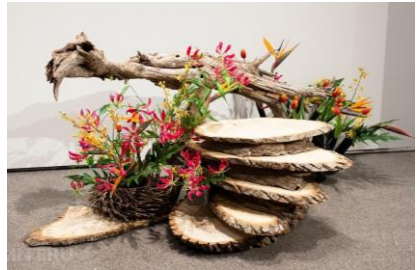
Рис. 4. Рутарій