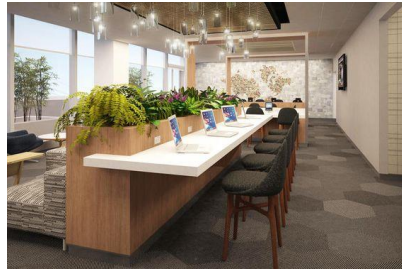
Рис. 10. Озеленення робочого місця

Дешевим аналогом фітостіни може стати будь-яка в'юнка рослина, яка висаджується в підлогові горщики та підв'язується чи до залізної сітки, прикріпленої до стіни, чи до звичайних ниток та джгутів, переплетених між собою (рис. 9). При потребі більшої надійності використовується збита з дощочок решітка.