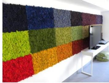
Рис. 8. Кольоровий стабілізований мох