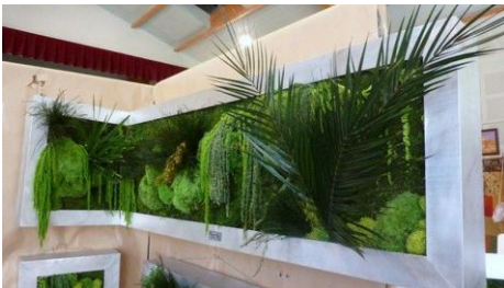
Рис. 5. Фітостіна