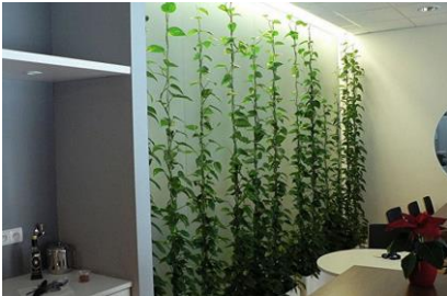
Рис. 9. Підв'язані рослини