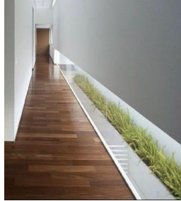
Рис. 2. Флораріум а) елемент інтер'єру