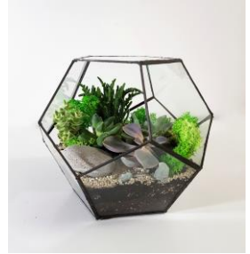
Рис. 2. Флораріум б) настільний