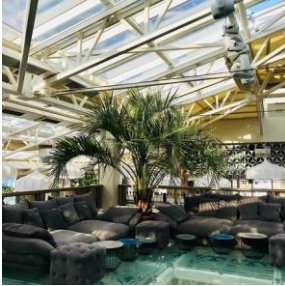
Рис. 1. Солітер

безпеку для людей та тварин. В процесі модернізації моху є можливість змінювати його забарвлення, що дає чимало можливостей для декорування приміщень (рис. 8). Таке озеленення не потребує ніякого догляду, але боїться морозів та прямих сонячних променів [7].