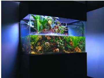
Рис. 3. Палюдаріум