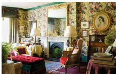
г) Ампір і Вікторіанський