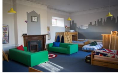
б) Кімнати хлопців