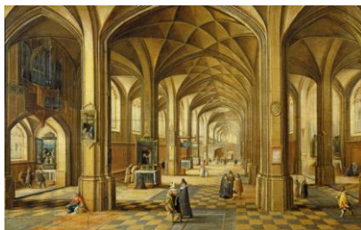
а) Романський і Готика