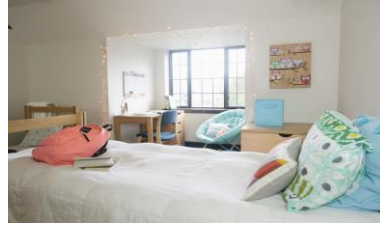
а) Кімнати дівчат