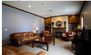
в) Зони відпочинку з гендерними ознаками