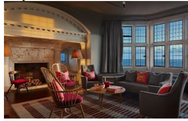
г) Зони відпочинку з нейтральними ознаками