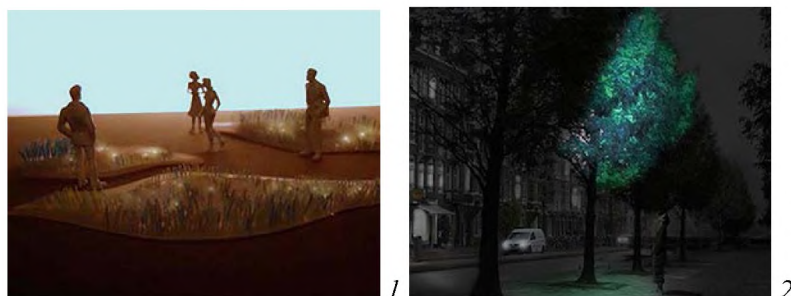
Рис. 3. Системний рівень інтеграції тимчасових зелених просторів: 1 – вуличний килим SHAGG, дизайнер Sean Lally, 2015 р.; 2 – Glowing Nature, дизайнер Daan Roosegaarde, 2014 р.

Системна інтеграція є найвищим рівнем інтегративних процесів. Вона базується на енергетичному взаємопроникненні штучних і природних елементів з метою створення цілісної системи. Прямий доступ до ресурсів природного середовища, вільний взаємний обмін енергією та інформацією між компонентами штучної та природної систем означає двосторонню взаємодію з можливістю їх злиття. Системна інтеграція як взаємне проникнення передбачає синтез методів проектування та усунення меж між ними. На практиці вона реалізується у вигляді експериментальних розробок, однією з яких є вуличний килим SHAGG [3]. Його поверхня – товсті щупальця – захищають від стороннього шуму, а спеціальний