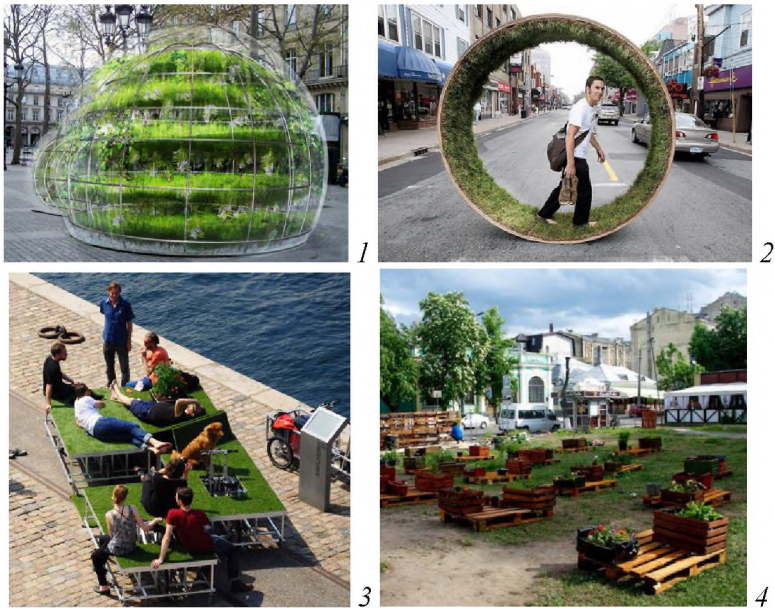
Рис. 1. Предметний рівень інтеграції тимчасових зелених просторів: 1 – «Бульбашкові сади», Голандія, 2010 р.; 2 – «Park Wheel!», Нова Шотландія, 2010 р.; 3 – модульний мобільний парк Parkcycle Swarm, Сан-Франциско, 2013 р.; 4 – перший pop-up community garden, Київ, 2015 р.

корисного ефекту для природного середовища і людини. Завдяки проектуванню матеріальних, інформаційних, енергетичних і часових зв'язків, які ґрунтуються на тісній взаємодії технічних і гуманітарних наук, забезпечується життєздатність дизайн-системи. Домінування певного виду зв'язків дозволяє виділити предметний, структурно-функціональний та системний рівні інтеграції, які визначають параметри адаптивності дизайн-системи.