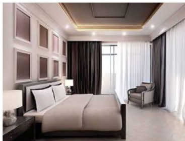
а) Прямі лінії