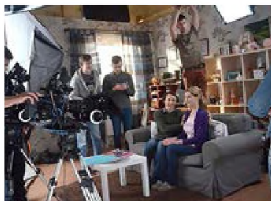
Рис. 3. Побутовий тип об'ємно-конструктивної організації