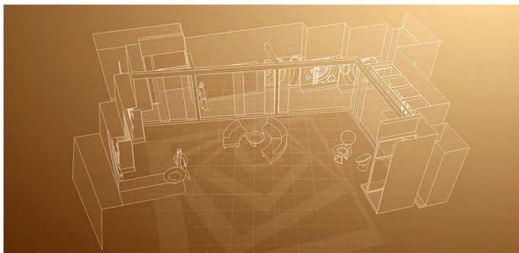
Рис. 4. Об'ємно-просторова організація телестудій ТВЦ «Настрій»

Варто зауважити, що у кінці ХХ ст., як правило, в одній класичній студії комбінують кілька підвидів об'ємно-конструктивної організації. Наприклад, програма телеканалу ТВЦ «Настрій»: у побудові об'ємно-конструктивної форми декорацій телестудій зосереджено відразу три функціональні зони – дві побутові і одна дикторська, що надає різноманітні плани і комбінації при зйомках (Рис.4).