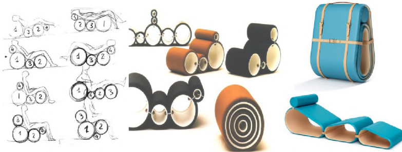
Рис.4. Реплікація функціональної схеми портативного Tube Lounge 1969 р. від Джо Коломбо у моделі Long Chair Марселя Вандерса для Louis Vuitton 2016 р.

У 1988 році на Мангеттені відчинив двері готель Royalton. Це був перший в світі butik-готель з інтер'єрами від Філіпа Старка. Простір був організований у дусі постмодернізму і продуманий як театральна сцена для сюжету настроїв. Атмосфера досяжного розкошу, престижного дизайну, колекція естетизованих артефактів отчувала відвідувачів. Інтимний простір став не менш значущим, ніж громадський. Концепція «Дизайн як стиль життя» стала новою темою наступних десятиліть і розповсюдилась за межі елітарного прошарку суспільства [4]. Арт-дизайн опанував предметно-просторовий інтер'єрний формат для різних верств користувачів. Долучення