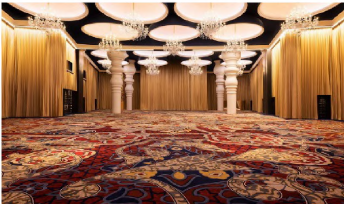
Рис. 7. Чудова історія розгортається навколо кожного повороту і готелю Mondrian Doha в Катарі від SWA та Марселя Вандерса (2017)