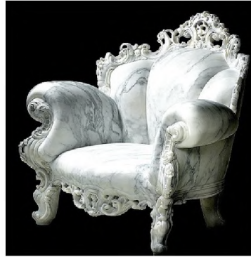
Рис.1. Репліки крісла Proust Алессандро Мендіні 1978, 1993, 2011 та 2014 р.р., виготовлені з застосуванням нових технологій та матеріалів.

Прикладом прийому реплікації на базі застосування аналогічної технології і матеріалу та створення подібної, але ускладненої форми, є славетний Panton Chair та парні стільці Фабіо Новембре Nim&Her 2008р. для Casamania. Вернер Пантон винайшов оригінальну форму консольного пластикового стільця, виготовленого з суцільного листа у 1959-1960 р.р. Ідея настільки випереджала час, що потребувала дослідів та експериментів, і виробництво першого взірця стало можливим лише у 1967р. Подальше вдосконалення технології до 1980р. довело геніальну прозорливість автора та зробило стілець іконою дизайну. Новембре використав конструктивні та 30