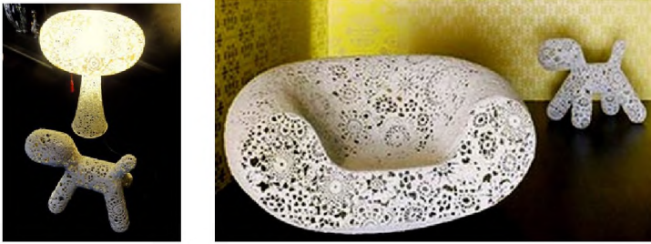
Рис.3. Реплікація технології в'язання гачком для виготовлення нового продукту Crochet для MOOOI 2001р. Марсель Вандерс