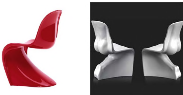
Рис.2. Реплікація конструктивних та технологічних характеристик Panton Chair Вернера Пантона для VITRA з частковою зміною форми в стільцях Him&Her Фабіо Новембре.

технологічні досягнення попередника і, залишивши внутрішню поверхню функціональною, зовні створив нову еротичну форму (рис.2).