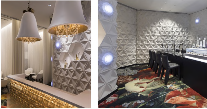
Рис.8. Фантазійний простір для відновлення розуму, душі та тіла: салон професійної косметики та СПА Maison De Corte від Марселя Вандерса, Токіо (2017).

Висновки. На основі проведеного дослідження можна виділити основні прийоми реплікації в дизайні інтер'єру: відтворення форми, створення аналогу конструкції, запозичення технології виготовлення, копіювання функціональної схеми, стилізація за рахунок використання артефактів як ознак того чи іншого стилю, реплікація філософських принципів формоутворення.