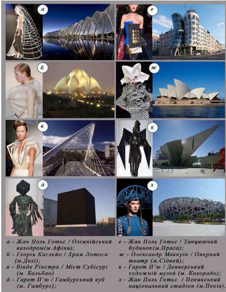
Рис.1. Асоціативно-інспіративний ряд костюмів з каркасами в колекціях світових дизайнерів

світу. Розподіл популярності архітектурних джерел творчості за географічною приналежністю є дещо нерівномірний, що пояснюється різним культурним розвитком того чи іншого регіону, багатством історичної архітектурної спадщини, новаторством ідей сучасних митців, що працюють на заданій території (рис.2).