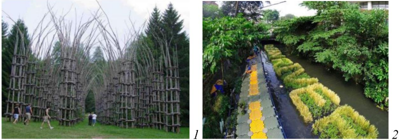
Рис. 3. Принцип взаємопроникнення у відкритих дизайн-системах: 1 – храм із живих дерев, арх. Джуліано Маурі, 2014 р.; 2 – плаваючий щит «Clean River Soon», р. Пасиг, Філіппіни, 2014 р.

системою є плавучий живий рекламний щит на річці Пасиг (Філіппіни), який фільтрує річкову воду, очищуючи її від токсичних матеріалів (рис. 3:2). Описані просторові структури можемо розглядати як модель створеного людиною простору, інтегрованого в природу, і впорядкованого на основі принципу взаємопроникнення. За рахунок цього відкрита дизайн-система переходить на мегарівень – рівень природного середовища.