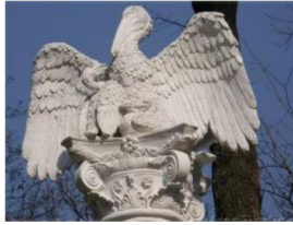
б) колона «Пелікан», відтворена копія