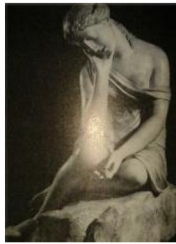
д) статуя «Молочниця», автор – П.П. Соколов.