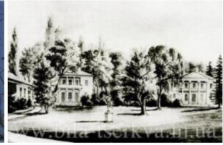
в) статуя «Меркурій» на картині «Вид на павільйони», Наполеон Орда