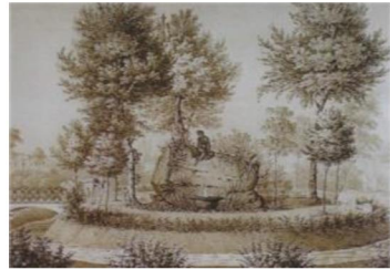
е) картина «Композиція «Варна», Вілібальд Ріхтер