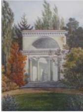
а) картина Вілібальда Ріхтера. Ротонда 1828 р.