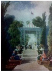
г) картина «Вид на Китайський місток», Вілібальд Ріхтер