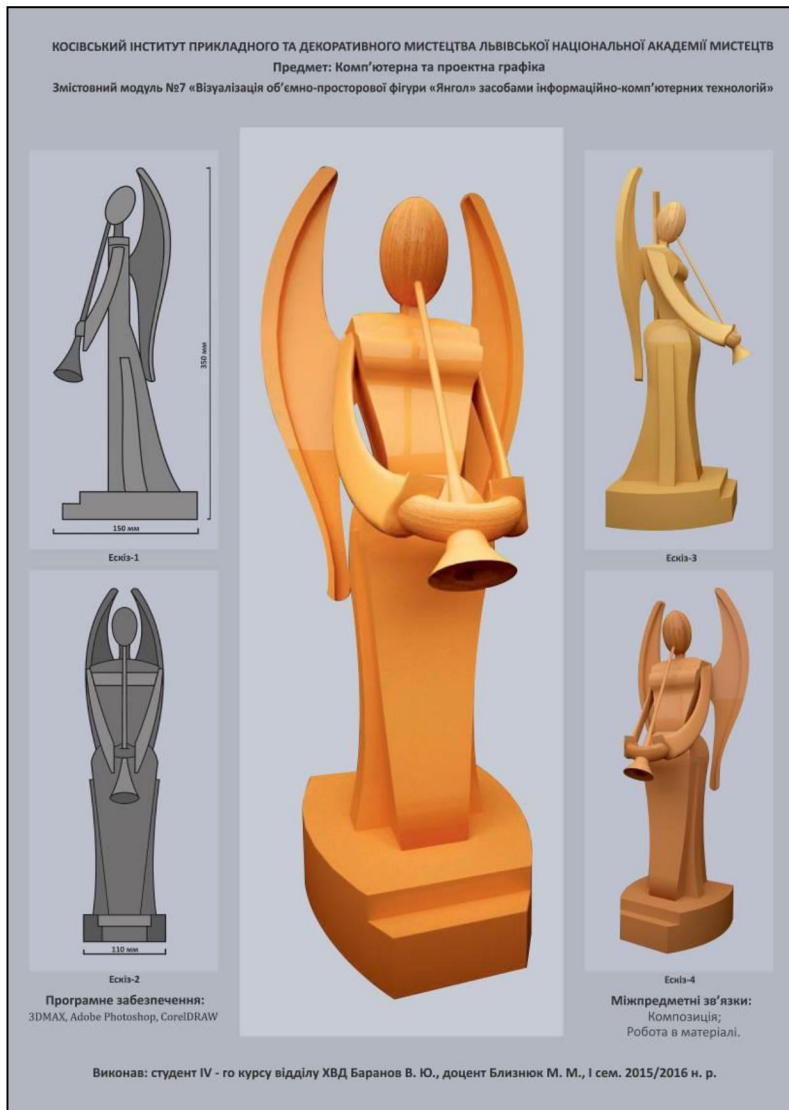
Рис. 3. Загальний вигляд презентації курсового проекту роботи кваліфікаційного рівня «Бакалавр» (програми 3D MAX, Adobe Photoshop, Corel Draw)