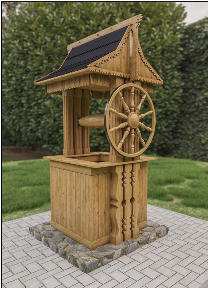
Рис. 2. Візуалізація курсового завдання оформлення криниці в народному стилі (програма 3D MAX)