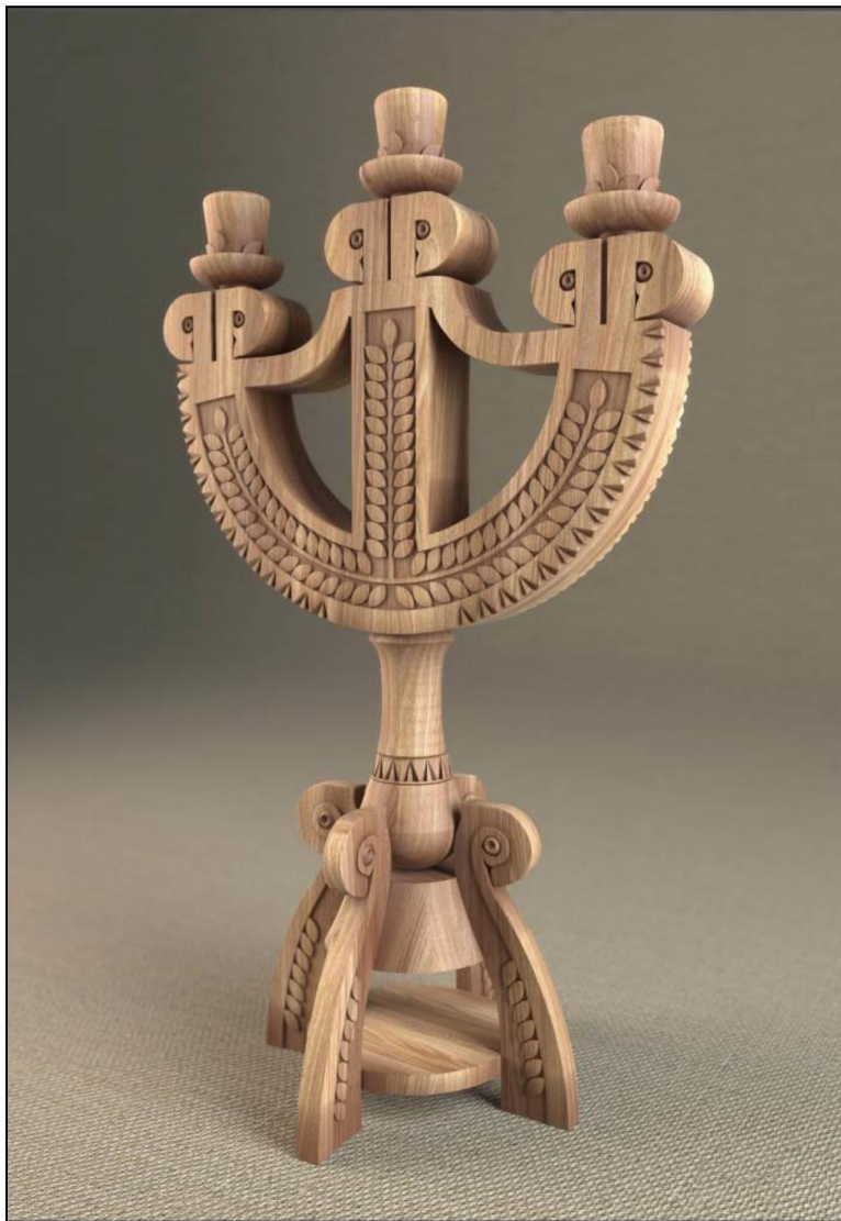
Рис. 1. Візуалізація курсового завдання проекту декоративного свічника (програма 3D MAX)