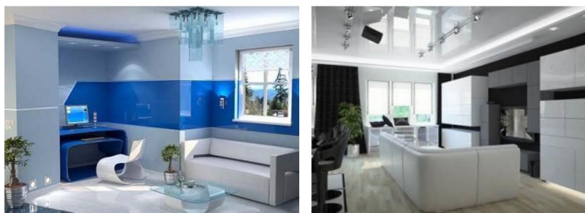
Рис. 5. Пластикові поверхні в інтер'єрі

В інтер'єрі хай теку прийнято використовувати пластик на основі акрилу, поліетилен, полікарбонат, вони безпечні в порівнянні з попередниками. Такий пластик «дихає» і бере участь у повторній утилізації, виділяючи мінімум токсичних продуктів. Стійкість до забруднень і псування властива кожному з цих матеріалів. Вони не бояться перепадів температур, побутової хімії, мають правильні геометричні форми.