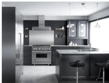
Рис. 3. Металеві поверхні в інтер'єрі

Дивлячись на такий інтер'єр, створюється відчуття впевненості і в той же час легкості. Поєднання металу і скла підійде для створення перегородок, вікон і дверей в стилі хай-тек. Значення скляних поверхонь і предметів меблів, в яких вони використовуються в інтер'єрі, важко переоцінити, вони скрізь: на кухні та у ванній, в вітальні і спальні: двері шаф, душових кабін, навіть скляні раковини і підлоги. Саме завдяки склу обстановка помешкання стає просторою, наповненою сонячним світлом і повітрям.