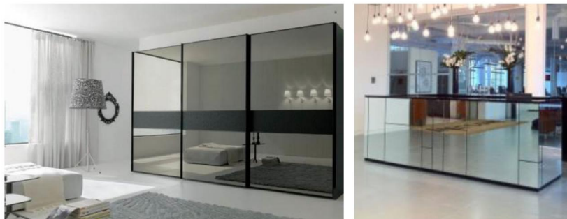
Рис. 2. Дзеркальні поверхні на предметах меблів

Дзеркала також можуть приховати деякі недоліки інтер'єру, візуально розсунути простір, виконуючи свою функцію відображати і за рахунок відображення «збільшувати» площу приміщень, що дуже важливо при створенні інтер'єру в стилі хай-тек.