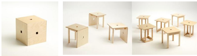
Рис. 1. Перехід форми до трансформації

він же перетворюється в парту, а стілець стає вище, а потім парта стає комп'ютерним столом. Крім цього, меблі-трансформери дають можливість звільнити простір в дитячій для ігор.