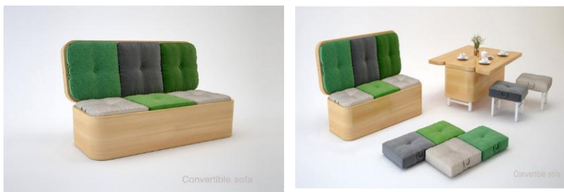
Рис. 3. Диван-трансформер «Convertible Sofa»

Каркасний тип конструкції має характерну жорстку раму чи інший каркасний елемент, що має обмежений діапазон рухів. Основна перевага такого типу конструкцій – це надійність, довговічність та простота у використанні, який легко трансформується. Таким прикладом меблів-трансформерів являється диван «Convertible Sofa», що створений українським дизайнером Юлією Кононенко. Простий з вигляду, він легко перетворюється у місткий стіл і кілька м'яких пуфів. Практичне рішення для молодіжних інтер'єрів і навіть офісних приміщень, де так часто не вистачає елементарного затишку і місць для відпочинку (рис. 3).