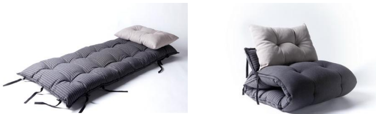
Рис.4. Матрац-крісло «Teb Bed»

В тісних житлових умовах безкаркасні конструкції меблів мають значний попит. Такі меблі можуть використовуватися в обмежених умовах, для гостьового варіанту та для тих, хто любить відпочивати на природі. Хорошим прикладом є матрац-крісло «Teb Bed», що створене Volen Valentinov і студії All In у Болгарії в 2013р. До матрацу додається пара подушок: трикутна і прямокутна, виготовлені вони з відходів тканини і набивання, які використовувалися для пошиття матраца (рис. 4).