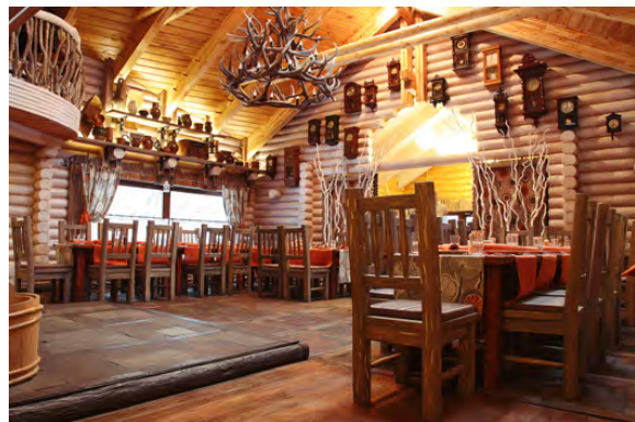
Рис. 6. Ресторан "Є-мос" м. Донецьк