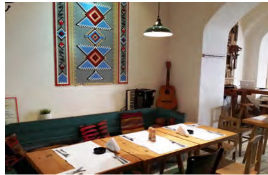
Рис.4. Ресторан Lacrimi si Sfinti . Бухарест

Проект інтер'єру ресторану Lacrimi si Sfinti в Бухаресті (рис.4), автором якого є дизайнер Cristian Corvin, отримав спеціальну премію 2012 Bucharest Annual. Самобутня атмосфера цього місця сформована завдяки майстерному поєднанню в інтер'єрі вантажних і сучасних деталей.