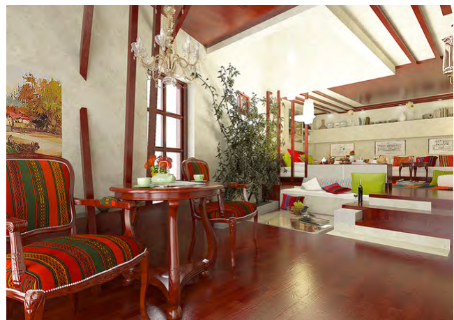
Рис.1. Готельно-ресторанний комплекс в Болгарії, студія Gemelli Design

Етнодизайн в сучасній інтерпретації – це яскрава суміш традицій і сучасних мотивів, які разом творять простір. Одним з яскравих прикладів подібного проекту є готель в Пловдиві – древньому місті в Болгарії.