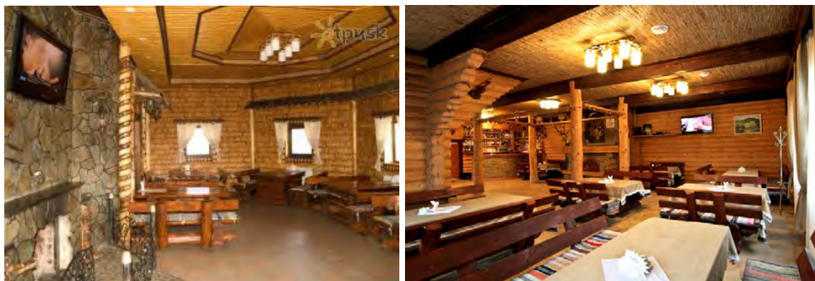
Рис 7. Готель-ресторан "Старий Плай" м. Закарпатська область

Матеріали для облаштування інтер'єрів в етностилі різноманітні, як і національні особливості тієї або іншої країни. Для оздоблення, зазвичай, використовуються або природні матеріали, або їх імітація. Причому імітація має бути фактурною, інколи навіть нарочито грубою, нагадує "необроблену" поверхню.