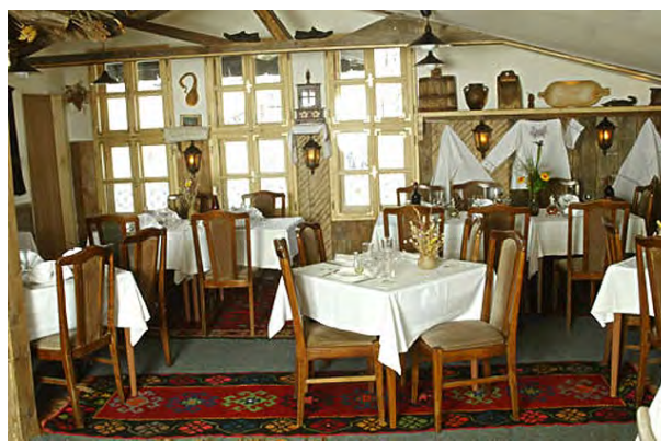
Рис.3. Ресторан "Златар" м.Белград

Ресторан “Златар” спроектовано у 1985 році з використанням сербських традицій. На рис. 3. представлено два обідні зали, що обслуговують 110 осіб. Колірна гама є спокійною, а світло не є яскравим, локальне, освітлено окремі частини приміщення.