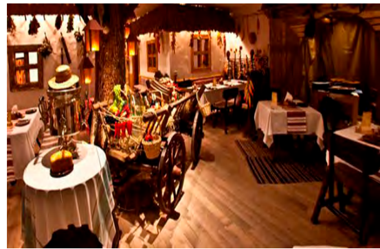
Рис. 5. Ресторан "Корчма" м. Запоріжжя