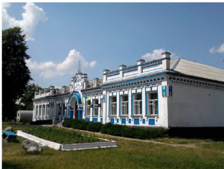
Рис. 2. Двокласне училище (гімназія) 1909 р. в с. Германівка.