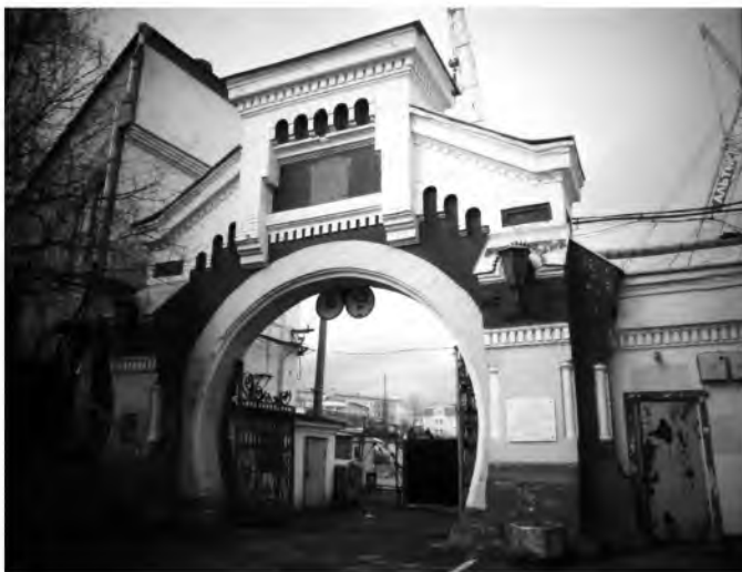
Рис. 1. Брама колишнього казенного винного складу на Деміївці. 1897.