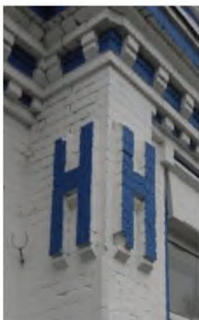
Рис.3. Літера «Н» на фасадах богадільні та двокласного училища