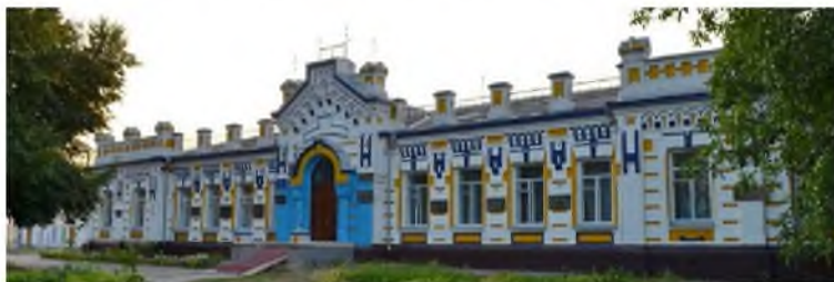
Рис.5. Богадільня 1907 – 1908 рр. в с. Германівка.