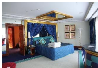
Рис. 2. Використання дзеркальних вставок на стелі

Практика використання дзеркальних поверхонь широко застосовується в стилі оп-ар, який ще з часів появи привернув увагу дизайнерів для створення інтер'єрів громадського простору.