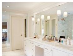
Рис.1. Розміщення дзеркал біля джерел світла

Якщо дзеркала висять під кутом, може виникати неприємне відчуття спотворення простору. Якщо використовувати дзеркала на двох протилежних стінах, створиться ефект нескінченного