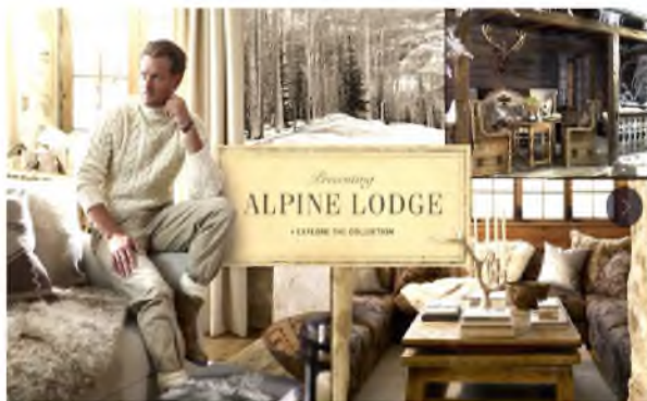
Рис. 6. Фрагмент презентаційного буклету інтер'єрної колекції «Альпійський будиночок» Ральфа Лоурена

В дизайні інтер'єру цю роль виконує комплект презентаційних планшетів ескізного проекту або колекції виробів – меблів, світильників тощо, який супроводжує комплект професійних креслень (рис.6).