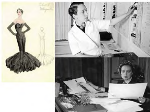
Рис. 5. Моделювання одягу. Ельза Скіапареллі в процесі розробки дошки настрою для моделей суконь.

В дизайні інтер'єру цей тип використовується для розробки акцентних елементів функціонально-планувальної структури або художньої композиції і попереднього (до розробки загальної концепції) обговорення з замовником.