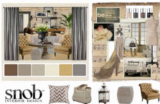
Рис. 2. Приклад дошки настрою, яка створена з використанням комп'ютерних технологій.

Визначено, що певним етапам розробки проекту відповідають особливі види дошки настрою і використовуються відповідні інструменти та техніки розробки.