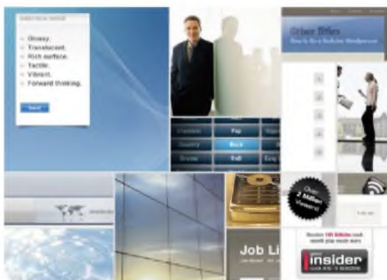
Рис. 3. Приклад релевантної дошки настрою у Web-дизайні

1. Релевантна дошка настрою (Relevant mood board) - створюється до початку розробки на першому етапі спілкування замовника і розробника-дизайнера. Попереджає проектування і призначена для узгодження уявлень замовника та розробника про задачі та якості майбутнього продукту. Колаж складається з тез-вимог замовника до проекту («дерево бажань») і зображень, запропонованих дизайнером та погоджених клієнтом, кожне з яких ілюструє конкретну якість проекту (рис.3).