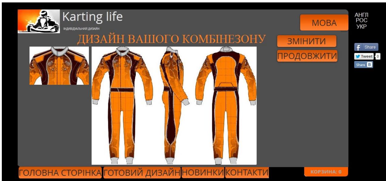
Рис.3 Зображення головної сторінки ІА по замовленню індивідуального дизайну КЗКС

В основі процесу розробки нових КЗКС за допомогою ІА покладено принцип комбінаторики, тобто комбінування запропонованих варіантів деталей виробу, матеріалів, кольорів, оздоблення тощо. Цей метод дозволяє отримати досить широкий асортиментний ряд виробів, які виглядають гармонійно та оригінально не зважаючи на уніфікованість деталей.