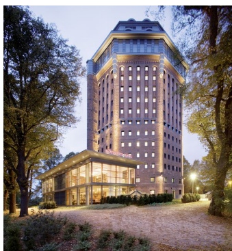
а) екстер'єр готелю