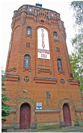
а) головний фасад

Загальна висота вежі – 31 м. Вона є однією із складових атрибутів візитки міста. (рис. 1).