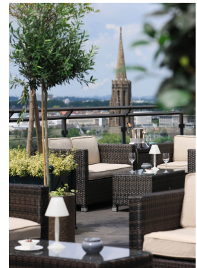
в) панорама з ресторану