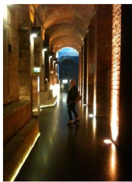
б) інтер'єр дизайн коридору