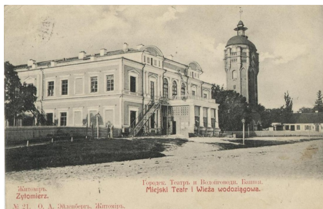
Рис.2. Листівка з зображенням житомирської філармонії та водонапірної вежі. 1930 р.

Вежа розташована за адресою: вул. Пушкінська, 24, поряд з обласною філармонією, на одній з центральних площ міста – Театральній (рис. 2.). Через свою автентичну неповторність на території України, реконструйована під готельно-ресторанний комплекс, вежа стане осередком туристичного відпочинку та культурного життя міста.