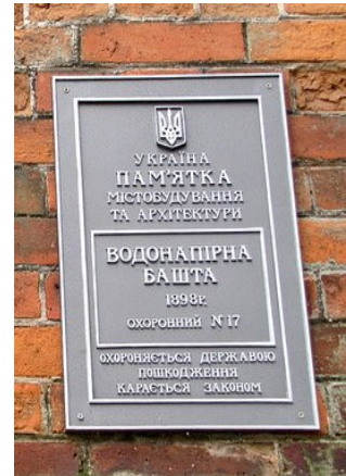
в) пам'яткоохоронний знак