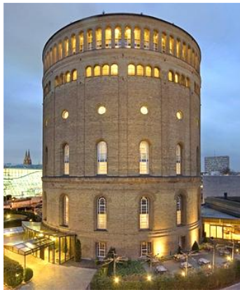
а) екстер'єр готелю

Готель «Im Wasserturm» Кельн, Німеччина (Рис.3.). До 1990 р. колишня водонапірна вежа - она з найбільших в Європі. Зараз це і історичний пам'ятник, і готель на 88 номерів, що являється окрасою міста та центром туризму.