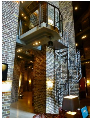
б) інтер'єр частини холу