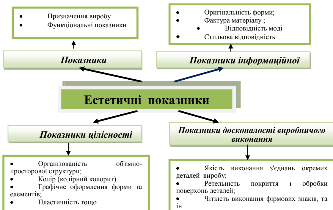
Рис. 1. Структурна схема естетичних показників

Загальну схему естетичних показників, які впливають на дизайн жіночого взуття, представлено на рис. 1