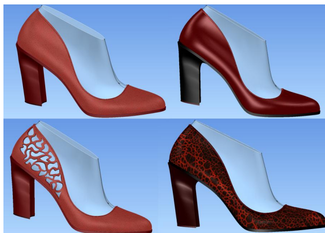
Рис.3. Розроблений дизайн колекції жіночих туфель, враховуючи вагомість естетичних показників взуття в програмному середовищі Crispin

В результаті отриманих результатів дослідження, було розроблено дизайн колекції жіночих туфель в програмному середовищі Crispin, акцентуючи увагу на формі, кольорі та фактурі матеріалів (рис. 3).