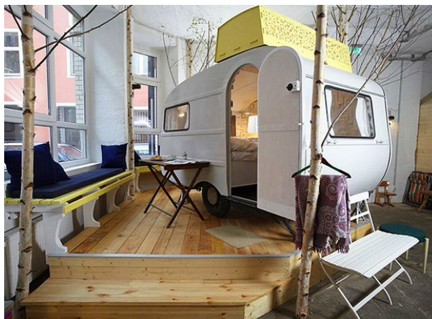
Рис. 5. Готель Huttenpalast в колишній фабриці пилососів, Берлін

Готель Huttenpalast в колишній фабриці пилососів. Як відомо, Європа вже практично не виробляє побутові прилади – ці потужності давно переведені в країни Азії. А приміщення колишніх заводів масово закриваються і переобладнуються для інших функцій. Наприклад, колишня фабрика пилососів в Берліні перетворилася на незвичайний готель Huttenpalast, що дає відвідувачам атмосферу відпочинку на природі.