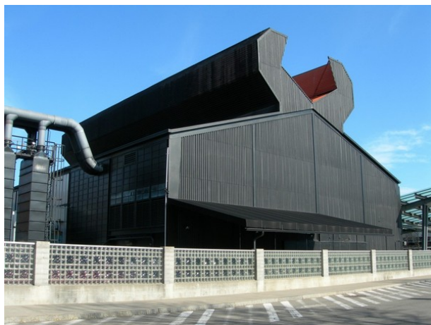
Рис.8. Музей Скла в м. Корнінг, штат Нью-Йорк

Найчастіше старі заводи перебудовують у музеї, експозиція яких розповідає про історію споруди. Подібна трансформація відбулася і в місті Корнінг в штаті Нью-Йорк, де колишня фабрика з виробництва скляних виробів перетворилася на Музей Скла (The Corning Museum of Glass) .