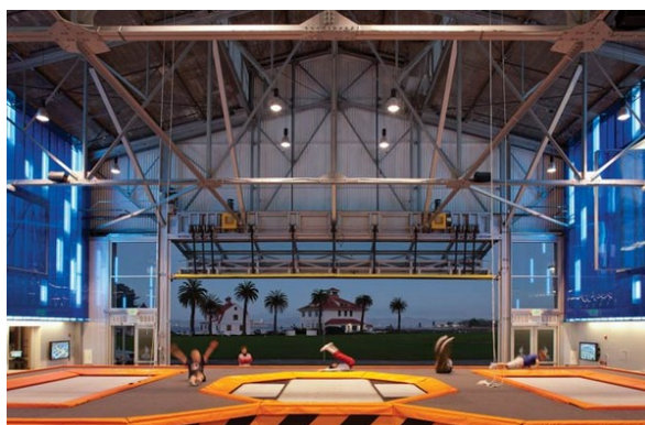
Рис.10. House of Air – батутний центр в авіаційному ангарі, Сан-Франциско.

House of Air – батутний центр в авіаційному ангарі біля підніжжя моста Золоті Ворота в Сан-Франциско.