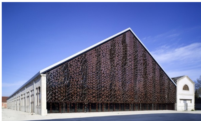
Рис. 9. Картинна галерея в будівлі залізничних майстерень, Прованс.

Картинна галерея сучасного мистецтва в будівлі залізничних майстерень виникла кілька років тому в одному з міст Провансу. Навіть зовнішня частина цієї споруди відповідає новій його концепції – фасад, завдяки сотням тисяч світлодіодів, можна використовувати в якості світлової інсталяції.