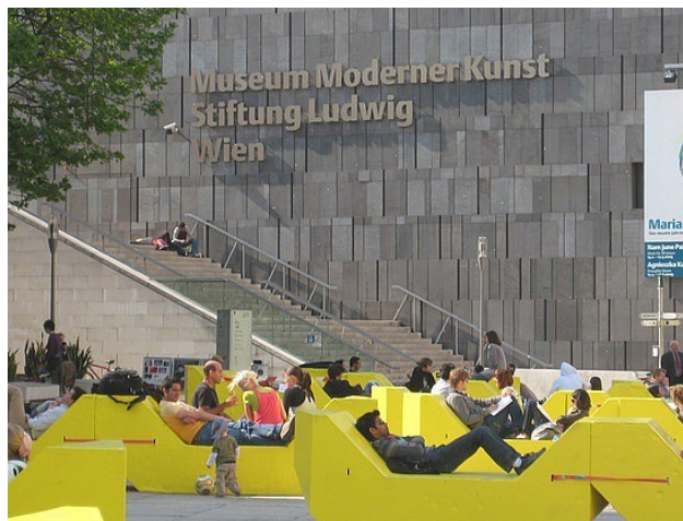
Рис.3. Музейний квартал у Відні.

Museum Quartier (Музейний квартал у Відні) – один з найбільших у світі комплексів і класичного сучасного мистецтва, що розташований в будівлях Королівських стаєнь. Процес реновації почався в 1998р. і був завершений в 2001р. До барокових споруд XVIII і XIX ст. добудовано сучасні будинки, спроектовані фірмою Ortner & Ortner Baukunst. Museum Quartier – це зосередження різноманітних музеїв і постійних експозицій в одному місці, серед яких: Leopold Museum, Museum of Modern Art, Kunsthalle Wien та багато інших. Але крім цього, Museum Quartier – це ще й креативний кластер, з офісами компаній, які розвивають проекти в області цифрової культури, моди, дизайну, архітектури і музики. З ними вдало співіснують телеканал, радіостанція, дизайн-форум, музей і магазин комп'ютерних ігор, кафе, книжковий магазин і студії для художників.