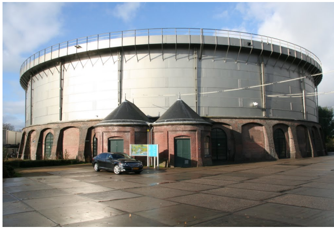
Рис.2. Культурний центр «Westergasfabriek», Амстердам.

Museum Quartier (Музейний квартал у Відні) – один з найбільших у світі комплексів і класичного сучасного мистецтва, що розташований в будівлях Королівських стаєнь. Процес реновації почався в 1998р. і був завершений в 2001р. До барокових споруд XVIII і XIX ст. добудовано сучасні будинки, спроектовані фірмою Ortner & Ortner Baukunst. Museum Quartier – це зосередження різноманітних музеїв і постійних експозицій в одному місці, серед яких: Leopold Museum, Museum of Modern Art, Kunsthalle Wien та багато інших. Але крім цього, Museum Quartier – це ще й креативний кластер, з офісами компаній, які розвивають проекти в області цифрової культури, моди, дизайну, архітектури і музики. З ними вдало співіснують телеканал, радіостанція, дизайн-форум, музей і магазин комп'ютерних ігор, кафе, книжковий магазин і студії для художників.