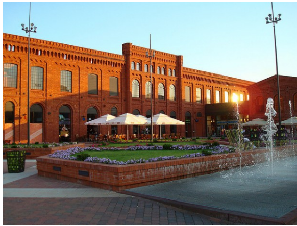
Рис. 4. Рекреаційно-розважальний центр Manufatura, Лодзь.

Manufatura є рекреаційно-розважальним центром з 15-ма кінотеатрами, стіною для скелелазіння, боулінгом, ареною лазерних ігор та іншими цікавими об'єктами. На території фабрики розташовані Музей міста Лодзь, Музей фабрики, Музей сучасного мистецтва "MS2" і театр. Завдяки проведеній ревіталізації одного промислового комплексу, місто стало одним з популярних туристичних центрів Польщі.