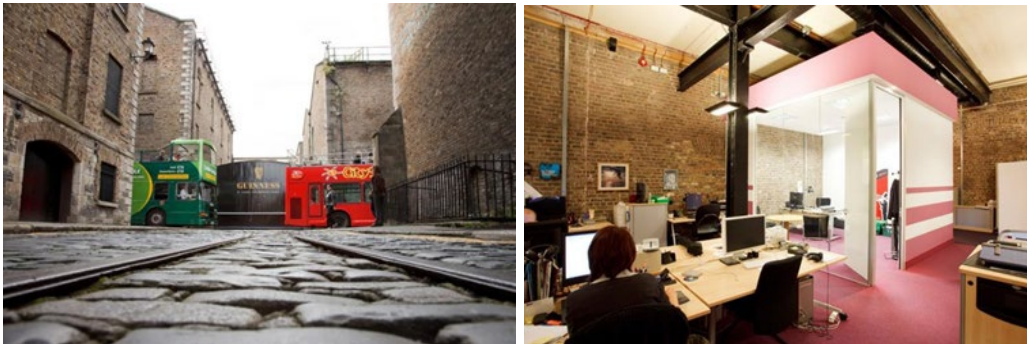
Рис.1. Офісний центр «The Digital Hub», Дублін.

The Digital Hub – реалізований проект реновації промислових будівель, що знаходяться в центрі Дубліна, який було розпочато в 2001 році, а вже в 2003 році сюди заїхали перші компанії. Зараз це офісний центр, який має галузеву спеціалізацію. Тут орендують приміщення тільки компанії, чий бізнес пов'язаний з високими технологіями: анімацією, розробкою мобільних додатків, комп'ютерних ігор, онлайн-медіа та створенням цифрового контенту – наприклад, Amazon, Areaman Productions, Daft та інші.