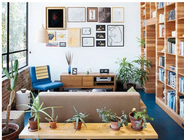
Рис.7. Житловий будинок Within a Box в колишній котельні в Каліфорнії

Within a Box – житловий будинок в колишній котельні в Каліфорнії. Цікавий приклад пристосування промислової споруди до житлової функції.