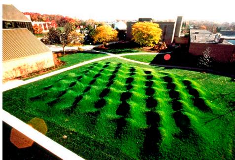
Рис 10. Майя Лин «Волновое поле» 1995

«Волновое поле» (1995) М. Лин - это серия ритмически расположенных земляных насыпей возле здания авиационно-космической техники Мичиганского Университета (США) (рис. 10). Образованный рельеф, демонстрирует визуальный образ влияния аэродинамики на жидкостные среды. Человек может физически войти в созданное ею поле и визуально представить исследуемые процессы. Это произведение ленд-арта не просто вплетается в ландшафт, как ранее рассмотренные примеры, а практически является его ландшафтным решением, т.е. произведение ленд-арта и ландшафтный дизайн, в данном случае, являются и тем и другим.