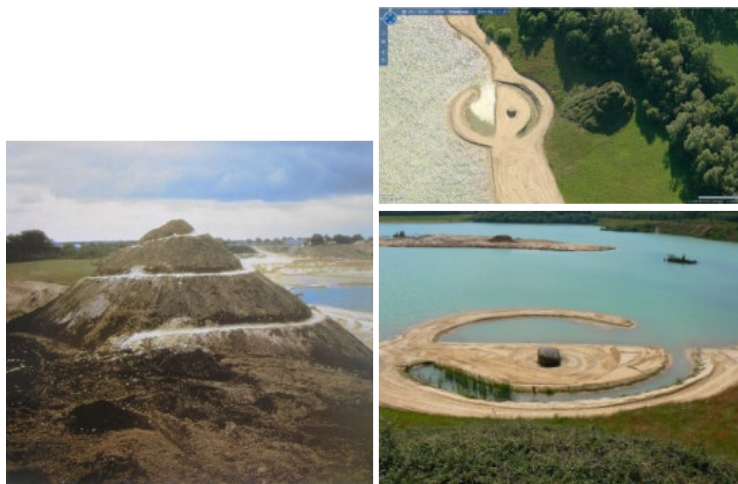
Рис 17. Р. Смитсон произведения «Спиральный холм» (1971) и «Разорванный круг» (1971)

Американский художник Р. Смитсон практически сразу в ленд-арте начал работать с депрессивными территориями: шлаковыми отвалами, карьерами. Он их рассматривает как скульптурный материал и пространство для творчества. Эти территории уже имеют свою негативную историю и их нельзя испортить (они уже испорчены). Так возникли произведения «Спиральный холм» (1971) и «Разорванный круг» (1971), созданные в Голландии (рис. 17). По идее художника произведения должны были постепенно исчезать под действием естественного разрушения, но по прошествии времени, местная общественность выступила за поддержание объектов в их оригинальной форме.