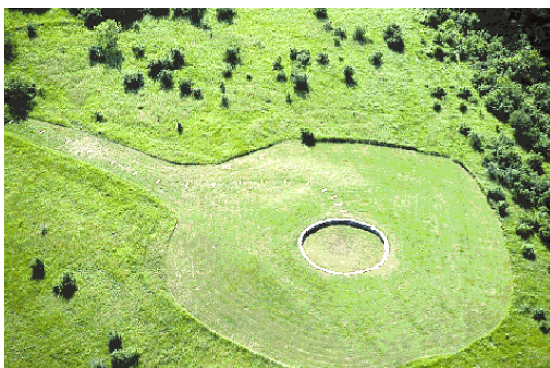
Рис 6. Майя Лин «Часовня» 1988-89 Заповедник Бейкер-Генри, Пенсильвания

Среди произведений американской художницы М. Лин (Maya Lin) так же есть созданные ландшафтные конфигурации, напоминающие древние артефакты - «Часовня мира» (1988-89) (рис. 6). Построенная на территории заповедника Бейкер-Генри (Baker-Henry) в штате Пенсильвания, она является частью его ландшафта.