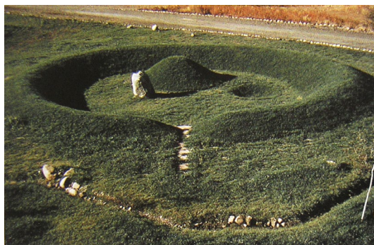
Рис 3. Г.Байер «Земляная насыпь» (1955)

«Земляная насыпь», построенная немецко-американским художником Г. Байером (H. Bayer) в 1955 году, - это насыпной вал в форме круга, в центре которого образован холм и установлен мегалит (рис. 3).