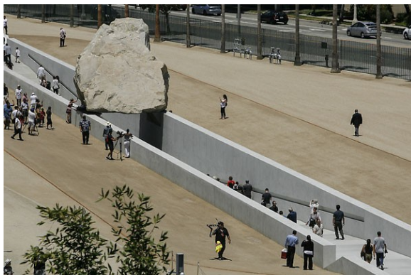
Рис. 2. М. Хейзер «Левитирующая масса (1969-2012)

Основной результат «Двойного отрицания» проявился в монументальной скульптуре «Левитирующая масса» (1969-2012) (рис. 2), созданной на территории музея искусства в Лос-Анджелесе. Эта «усовершенствованная версия» представляет собой глубокую железобетонную траншею. Над ее самой низшей точкой установлен 340-тонный гранитный мегалит, под которым проходят люди, т.е. аналогично, как в «Двойном отрицании» зритель может попасть внутрь скульптуры.