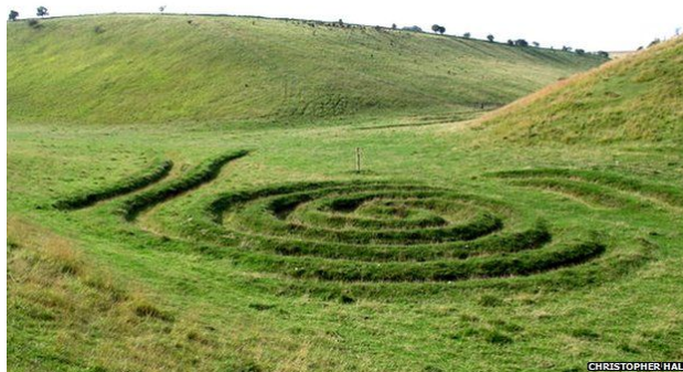
Рис 12. К.Дрери «Волны и Время» (2011) Йоркшир, Великобритания.

Еще одно произведение ленд-арта в сельской местности, способствующее оживлению и преобразованию пространства – это геопластика К. Дрери «Волны и Время» (2011), выполненное в деревне Зиксендейл (Thixendale) (Йоркшир, Великобритания) (рис. 12). В углублении между холмами располагаются два спиралевидных рельефа (большой и маленький), изображающие линии движения ледников, которые когда-то покрывали эту долину. Произведение создано в рамках развития туризма на пути Вулдс Вэй (Wolds Way).