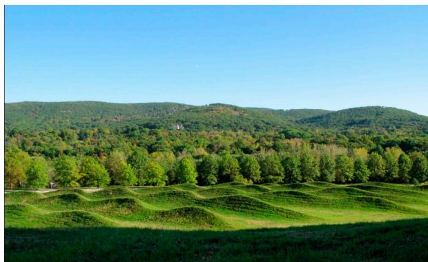
Рис 16. Майя Лин «Штормовое поле» 2009 Центр искусств, Mountainville Нью-Йорк.

М. Лин так же вносит свой вклад в опыт рекультивации земель. На территории Центра искусств «Storm King», который расположен в деревушке Маунтанвилле (Mountainville, Нью-Йорк), на месте отработанного карьера по добыче гравия художница создает «Штормовое поле» (2009) (рис. 16). Геопластика произведения состоит из семи рядов волнистого рельефа и напоминает море во время шторма в момент, когда высокие волны набегают одна на другую.