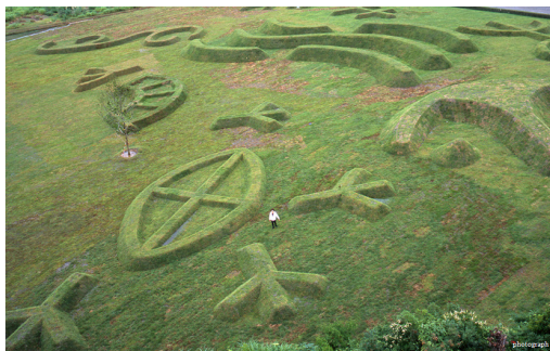
Рис 9. Ритсуко Тахо «Зеленая вилла» (2003)

Примером вышесказанного служит произведение японского художника Ритсуко Тахо (Ritsuko Taoh) «Зеленая вилла» (2003) (рис. 9). Художник изменил рельеф местности, создав огромные объемные иероглифы, написав добрые пожелания людям и этому месту. Это произведение внесло в ландшафтное пространство новые пластические, эстетические и смысловые качества.