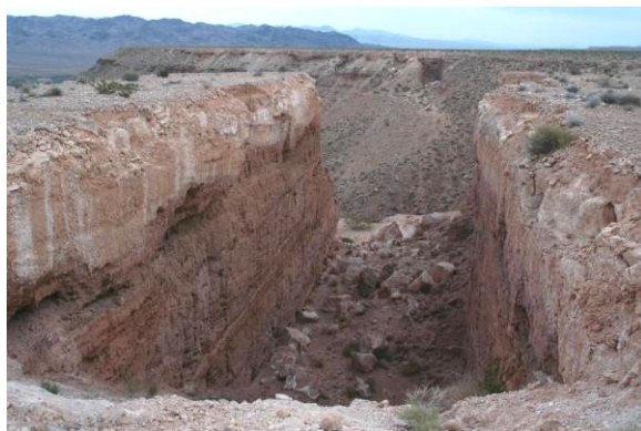
Рис. 1. М. Хейзер «Двойное отрицание»

Геопластические трансформации ленд – арта - это только часть от большого количества всех произведений этого направления современного искусства. Их следует рассматривать в зависимости от решаемых задач. Выделилось пять групп геопластических произведений ленд – арта.