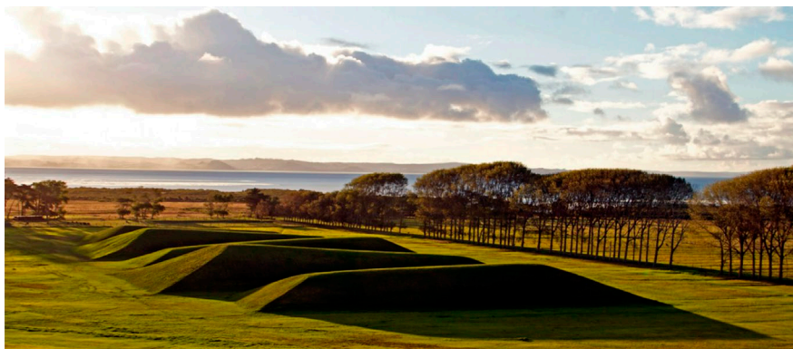
Рис 11. Майя Лин «Уложенные в поле»

земли» высотой 11,5 м., которые передают ритм набегающих волн (произведение «Уложенные в поле») (рис. 11). На территории произведения пасут овец и это согласуется с его поддержанием в своем первоначальном виде (сохранение травяного покрова определенной высоты). Ее понимание ландшафта: «что человек может подарить или вернуть природе», это то направление мысли, которое необходимо мировому сообществу. Соединение искусства с ландшафтным дизайном – необходимый вектор развития последнего.