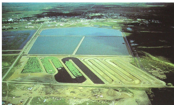
Рис 13. В. Нго Озеро Дьявола 1990

Так В. Нго в 1990 году очищает озеро Дьявола (Северная Дакота), используя систему Лемпа (естественный биологический способ очищения сточных вод). Для этого он построил девять соединенных каналов, похожих на змею, в которых удаляется вредный фосфор, азот и морские водоросли (рис. 13).