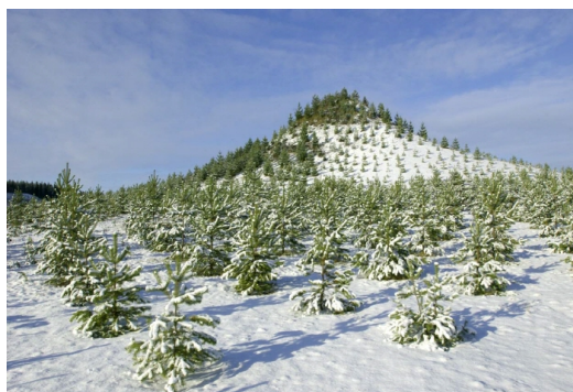
Рис 14. А. Денес «Гора дерева» (1982)

В 80-х годах XX века американская художница А. Денес по приглашению правительства Финляндии создает наибольший экологический памятник – «Гора дерева» (1982) (искусственная возвышенность 420 м – длиной, 270 м – шириной и 28 м. – высотой) (рис. 14). Посаженные на ней деревья, в количестве 10000 штук, создают спиралевидный рисунок.