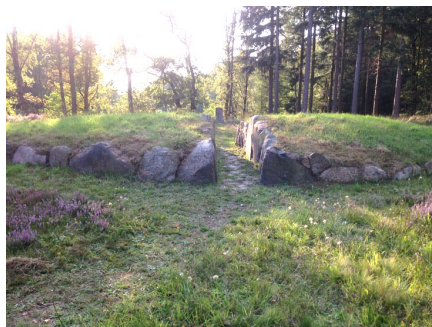
Рис 8. К. Дрери «Равноденствие» 2008.

В ландшафтном парке Шмокбаштал (Schmokbachtal), расположенном к югу от Гамбурга (Германия), он создал в разное время три работы. Одно из них «Равноденствие» (2008) обращено к истории места (рис. 8). «Равноденствие» - это овальная в плане насыпь, обложенная необработанными камнями. Через центр формы по ее самой узкой части проходит прямая траншея, ориентированная на восход и заход солнца (Восток – Запад).