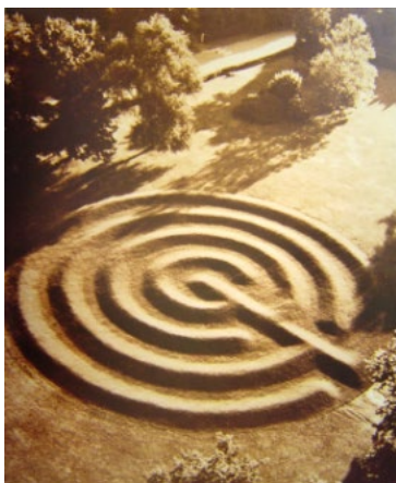
Рис 5. Р. Флейшнер «Лабиринт из дерна» (1974)

Среди произведений американской художницы М. Лин (Maya Lin) так же есть созданные ландшафтные конфигурации, напоминающие древние артефакты - «Часовня мира» (1988-89) (рис. 6). Построенная на территории заповедника Бейкер-Генри (Baker-Henry) в штате Пенсильвания, она является частью его ландшафта.