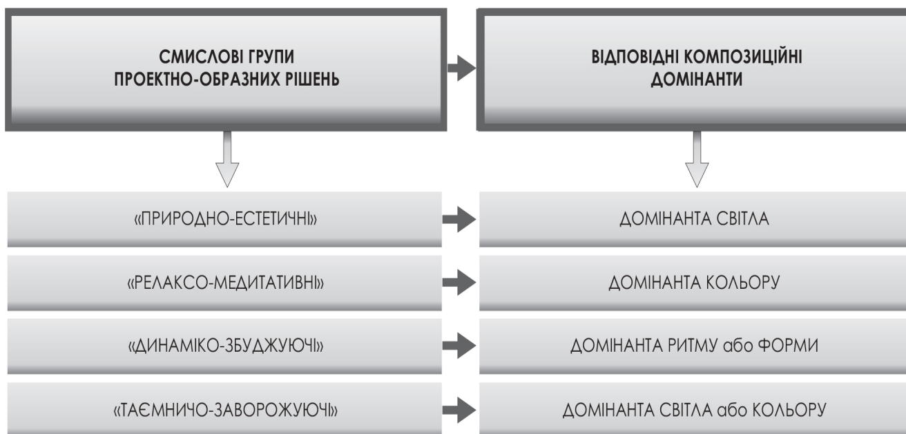
Рис. 5. Схематичне зображення взаємозв'язку композиційних домінант та смислових груп проектно-образних рішень

Висновки. В результаті дослідження визначено основні смислові групи проектно-образних рішень освітлення предметно-просторового середовища засобами LED-технологій, а саме: «природно-естетичні», «релаксо-медитативні», «динаміко-збуджуючі» та «таємничо-заворожуючі» проектно-образні рішення. Встановлено їх взаємозв'язок з відповідними композиційними домінантами, а саме: смислова група «природно-естетичні» вирішується переважно за рахунок композиційної домінанти світла, «релаксо-медитативні» – домінанти кольору, «динаміко-збуджуючі» – за рахунок домінант ритму або форми, «таємничо-заворожуючі» – за допомогою домінант світла або кольору.