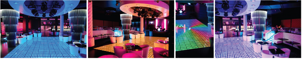
Рис. 3. Приклад «динаміко-збуджуючого» образного рішення – нічний клуб «Компас», проект компанії АРТ-Р, м. Харків

«Таємничо-заворожуючі» образні рішення (рис. 4) досягаються використанням тонких ліній кольорового світла, мерехтінням поодиноких світлових точок чи їх невеликих груп, помірних за площею відносно габаритів приміщення світлових плям різних конфігурацій і різних кольорів, множинним відбиванням світла за допомогою дзеркал, що створює ілюзію безкінечності простору. Ефект таємничості композиції досягається використанням «ніжного світла» (світіння не в повну яскравість) блакитного кольору з додаванням елементів теплого білого, наближеного до жовтого і динамікою «поблискування». Наша свідомість наділяє цей прийом ознаками «таємничості» завдяки асоціативному зв'язку з природними світловими ефектами ночі: зоряним небом (мерехтіння, поблискування світлових крапок), місяцем (білий колір наближений до жовтого) і ледь помітними «ніжно-блакитними» абрисами предметів. Підкреслимо, що ця група образних рішень є проміжною між першою і другою, поєднує в собі риси обох з характерними для них композиційними прийомами.