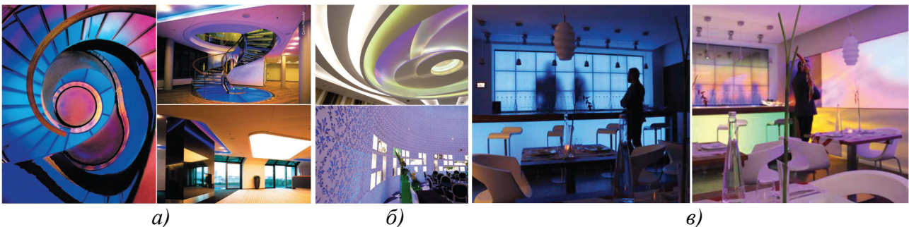
Рис. 2. Приклади «релаксо-медитативних» образних рішень: а – Банк HSH Nordbank, дизайн світла – Карлос Монтуфар, NHM architects; б – Joseph Huang, компанія TIGERRUSH CO; в – готель «Hotel du LAC», Philips.

«Релаксо-медитативні» образні рішення виражаються в мінливості кольорів, оптичних ілюзіях, прийомах театрального освітлення, підкресленій декоративності композиції, частково провокують сприйняття предметно-просторового середовища як «іншої реальності» (рис. 2).