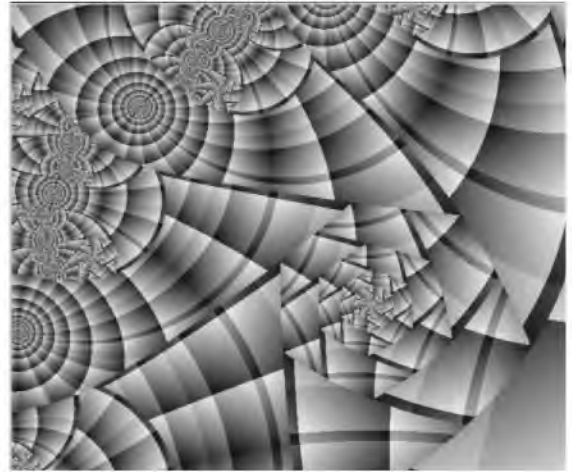
Рис.2. Приклади фракталів, естетична оцінка яких потребує використання засобів комп'ютерної графіки.

У свою чергу, у комп'ютерній графіці фрактали використовуються для візуалізації природних об'єктів (рис.3).