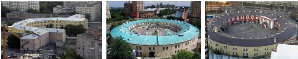
Редюїт № 1