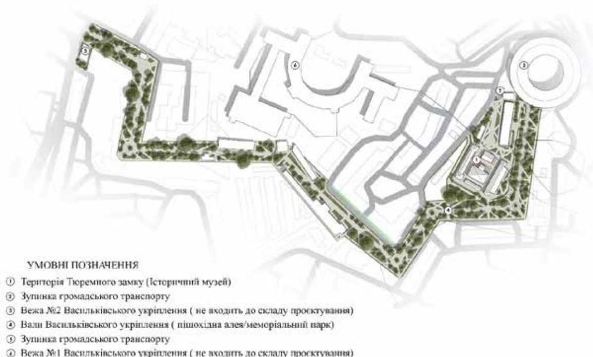
Рис. 4. Схема генплану з пропозицією створення нового середовища

• Розвиток інфраструктури: розробка прилеглих територій, включаючи створення додаткових зон відпочинку, кафе, магазинів створить комфортні умови та підвищить кількість та частоту їх відвідувань.