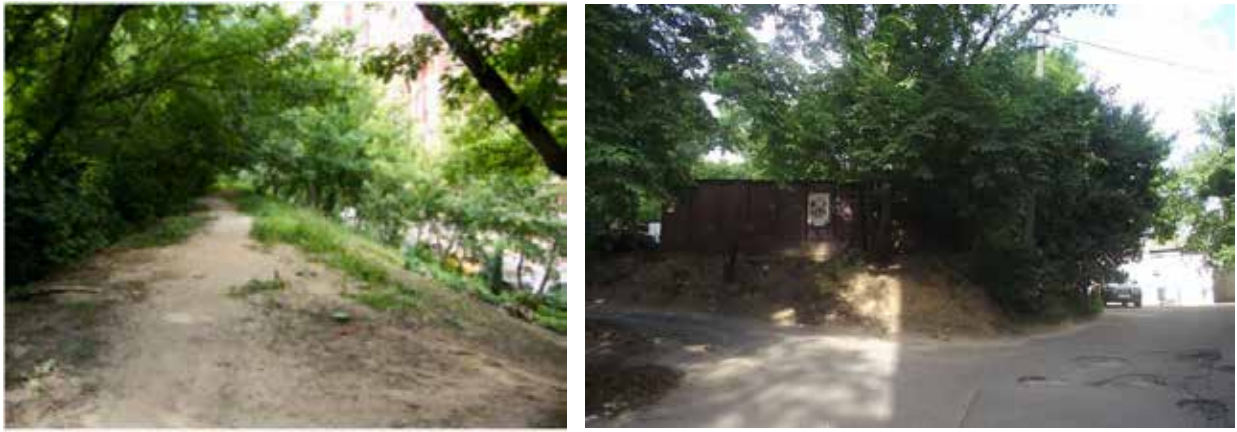
Рис. 2. Сучасний стан валів Васильківського укріплення