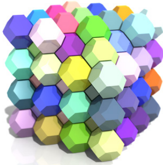
Рис. 3. Блокування поселення за допомогою форми скошеного октаедру

та буде кріпитися до металевого каркасу, що утворюватиме саму форму будівлі у вигляді скошеного октаедру. Стіни повинні бути утеплені пінополістиролом, для додаткового захисту від прохолодної температури. Між утеплювачем і реголітом буде додатковий шар з алюмінію та поліетилену для додаткового захисту від сонячної радіації.