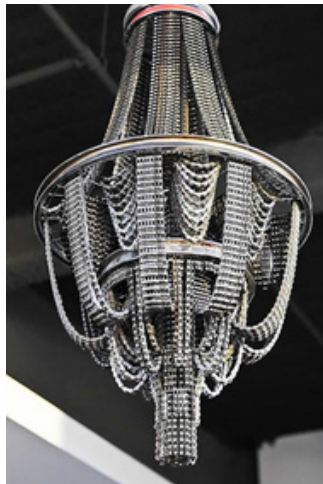
Рис. 8. «CONNECT 13» від Carolina Fontoura Alzaga [11]