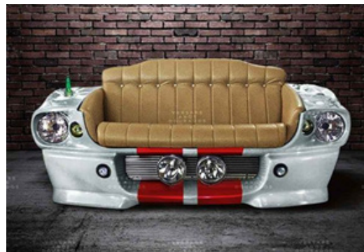
Рис. 6. Софа Mustang Poppy [20]