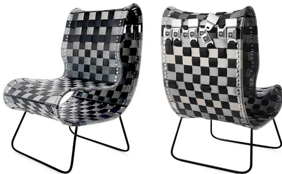
Рис. 9. 'Reclaimed Seatbelt Chair. дизайнер Adam Barron [16]