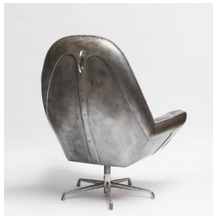
Рис. 5. Beetle Club Chair: перероблений капот VW від The Rag and Bone Man – upcycleDZINE [6]