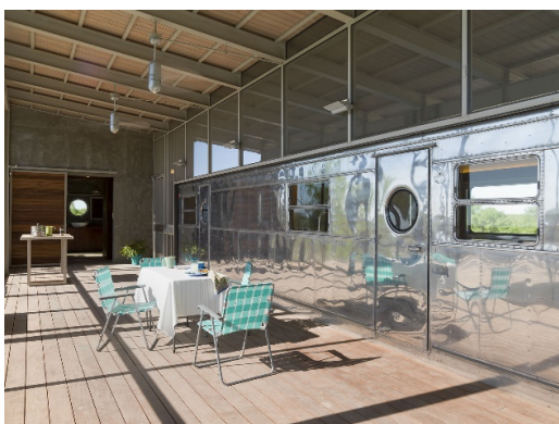
Рис. 1. Locomotive Ranch Trailer. Andrew Hinman Architecture [12]

3. Знайти засіб обробки різнохарактерних деталей, щоб таким чином «привести їх до одного знаменника» щодо матеріалів, кольору, текстури та фактури.