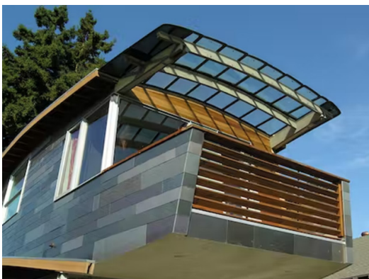
Рис. 3. McGee Salvage House у Сан-Франциско [14]