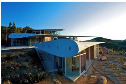
Рис. 2. 747 Wing House [10]