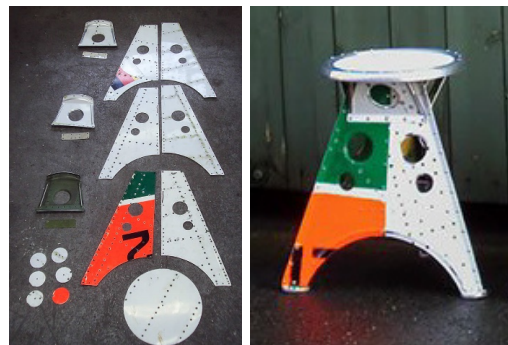
Рис. 4. «Авіаційний табурет» AERO-1946 [21]