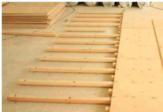
Рис. 4. Укладання підлоги на дерев'яні лаги

Таким чином, визначено що підлогове покриття є важливою складовою комфортного та безпечного танцювального середовища.