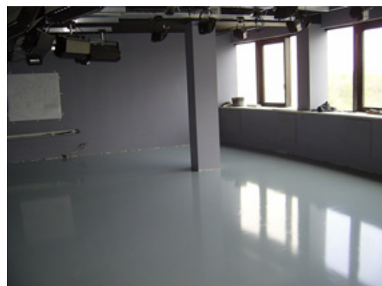
Рис. 5. Наливна підлога у танцювальному залі