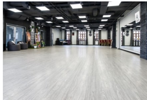
Рис. 2. Балетний лінолеум Harlequin Studio

Має широкий вибір асортименту. Може використовуватися у якості покриття підлоги у танцювальних та приміщеннях для репетицій (рис. 2).