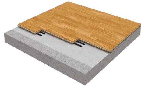
Рис. 3. Voflex Olympia