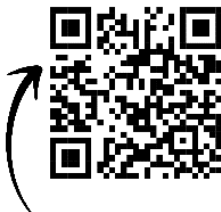
Рис. 2. Інформаційна методична скарбничка «Все для педагога-позашкільника»

Серед них – електронна методична скринька для педагогів позашкільля, яка знаходиться за QR-кодом (рис. 2) або посиланням: http://surl.li/jaywn та https://yulia26.netboard.me/c7rcm0pef07urrx/?link=RJOgVmdH-CNoCEWqf-a0CO7Mcq