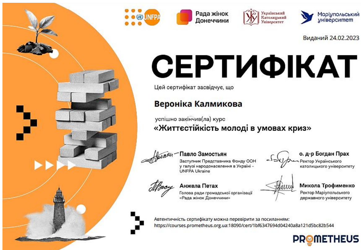
Рис. 2. Сертифікат, який отримують здобувачі освіти на платформі Prometheus

Наприклад: при вивченні освітнього компоненту «Безпека життєдіяльності» учасникам навчального процесу дається перелік безкоштовних курсів, що містяться на платформі освіченості Prometheus: «Життєстійкість молоді в умовах криз», «Цивільна оборона та захист у надзвичайних ситуаціях», «Інформаційна гігієна під час війни», «Навчання з попередження ризиків від вибухонебезпечних предметів», «Перша домедична допомога в умовах війни», «Здорове спілкування» тощо [1]. Контроль знань здійснюється за допомогою тесту, який повинен пройти учасник освітнього процесу. Підтвердженням вивчення матеріалу курсу студентом є електронний сертифікат (рис. 2), який він отримує після успішного тестування.